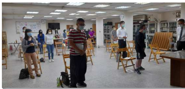
▲青職聖徒們於特會中奉獻自己

今年青職特會的總題是『進入主構上時代的恢復，傳承主榮耀的託付，帶進主再來的復興』。明年是主恢復一百年，倪柝聲弟兄說過，若非神給我們一個特別的呼召、特別的託付，我們並沒有在這裏存在的必要。弟兄們見證，主的恢復這一百年中，許多聖徒