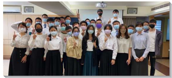
▲信基區北醫期初特會在四十會所舉行

特會結束後，服事者們一同交通，弟兄鼓勵我們，雖有許多逆勢還需要突破，但大學生們認真操練的情形仍非常激勵人。儘管本次特會可能因著線上和實體同步進行的方式，大學聖徒未能全部到齊，氣勢也不像實體一般強，但整個特會信息都向學生們發出得勝者的呼召。這三天的特會也把新耶路撒冷的異象向學生們開啓，每篇信息和專題都幫助大學生們在生活中操練過得勝的生活，並活出新耶路撒冷。