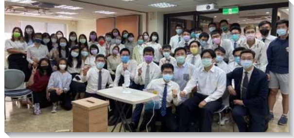
▲大安區台灣大學期初特會在十九會所舉行

城中大同區：因主憐憫，雖有疫情影響，本次城中大同區特會的實體部分仍能在一會所舉行，各校園的學生們從家中聚集到會場，從線上回歸到實體聚集。經過幾場聚集的相調，眾人的靈越過越剛強，更得著