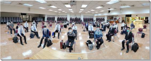
▲城中大同區大學期初特會在一會所舉行

本次特會的總題為『得勝者的呼召』，神需要奮力追求基督以得著基督的得勝者，神也需要婦人和男孩子。許多學生都對信息中說到『產生男孩子的路』很得開啓，惟有藉著接受基督到我們裏面，我們才能生出男孩