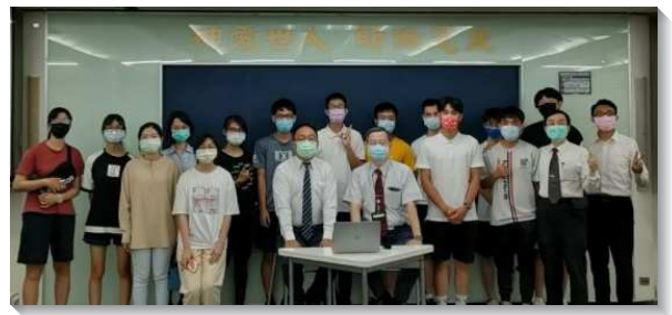
▲ 聖徒與大學生配搭福音講座

八月初，學生們深覺為著新學期要得著更多的大一新生，實在需要更多的禱告。所以就主動邀約聖徒們從週一到週五，每天早上九時，一同在線上為新學期得人的負擔守望禱告，為期一個月。這樣的實行是以前未有的。開始實行以後，每天都約有十五位學生及聖徒一同上線禱告，為主行動鋪路。感謝主，藉著這樣同心合意的禱告，在開學前就有五位學生搬入弟兄姊妹之家，使弟兄姊妹之家由原先的兩戶擴增為三