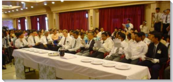
▲ 聖徒們參加於 Chennai 的全國性特會

經過半年之後，我們就開始到南方各地召會旅行，拜訪尋求者，並看望、牧養召會。常常坐十幾個鐘頭以上的火車後，換公車。弟兄來接我們時，再坐三輪車或機車。有時連車都不能到，就走路，甚至脫鞋過