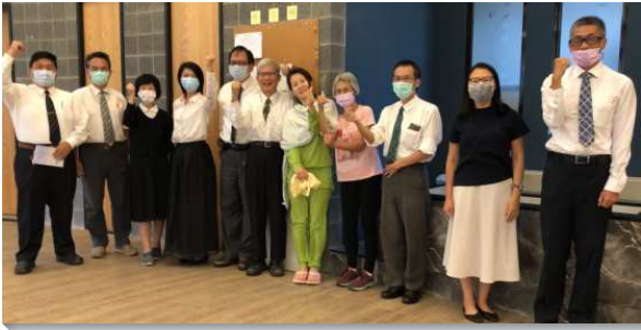
▲ 聖徒們牧養新人受浸得救

負擔推行的方式也是由圓心到圓周，一層一層的擴大交通，先是負責弟兄交通到負擔一致，弟兄再藉著