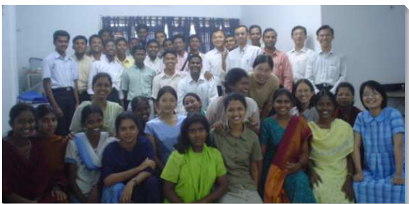
▲ 聖徒們參加訓練受成全

在此過程中，當時的政治局勢，取得居留簽證相當困難，那時我們嘗試很多管道，甚至求見社會部副部長，當面洽談可能取得簽證的方式，雖獲接見，卻未能成功。同年五月，弟兄們希望我們直接轉往印度，與宋燮城弟兄一同配搭。我們就在忐忑的心情中到了印度的清奈（Chennai），即當時開展工作的中心。