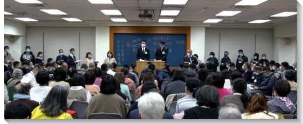
▲聖徒們參加城中、大同區冬季現場訓練

我們也藉著哈拿、撒母耳、大衛積極的一面，認識神渴望結束這世代而帶進國度時代。為此，我們需要有哈拿的職事以產生錫安。我們需要從撒母耳學功課，自願奉獻成為拿細耳人，成為與神是一的人。我們需要從大衛學習十字架的功課，並像大衛一樣顧到神在地上的居