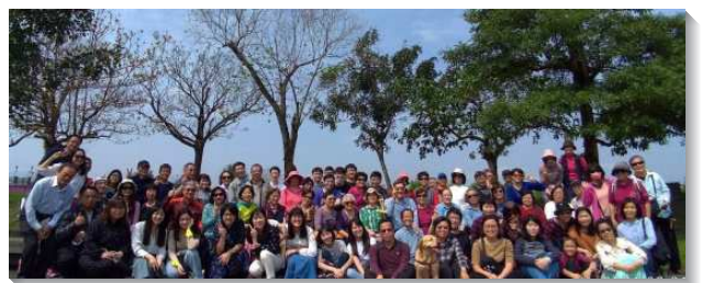
▲五十四會所和二十九會所增出九十五會所

二〇二二年正逢主的恢復達一百週年，在台北市召會繁增至一百個會所的目標行動中，本會所並沒有缺席。雖然經常聚會人數不是很多，約有一百六十位，然而靠著神的恩典，我們排除了一切困難，以信取代不信，積極取取消極，本會所的两个小區與二十九會所，於二〇