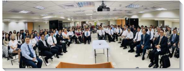
▲七十四會所於二〇一九年一月六日成立

恢復的青職聖徒，以初信讀本、牧養材料等陪讀。因著得救的新人多為青職，我們便安排得救較久的青職聖徒與他們同聚，彼此作同伴。除了週中，以及主日下午，定期與青職新人在聖徒家中聚集，我們也邀約他們一同外出相調。感謝主，將得救的人與我們加在一起。