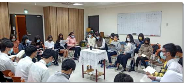
▲青年聖徒們積極追求真理

因此，自十月開始到十二月底，弟兄們在線上帶領聖徒進入真理課程一級卷一的前六課內容，平均每次上線