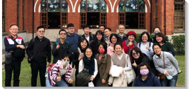
▲聖徒們積極擺上為基督與召會花費

直至八月份政府降低疫情警戒標準後，會所也隨即恢復主日實體及線上雙軌聚會。有幾位福音朋友因著聖徒邀約，週週參加線上的福音聚會，在疫情趨緩後於會所受浸得救。感謝主，這樣的見證激勵聖徒們在實行神命定之路上更有信心，繼續忠信的與主配合，