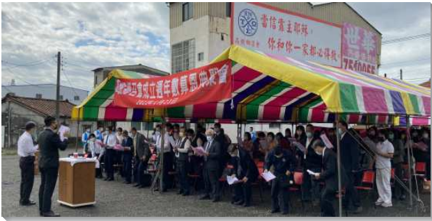
▲訓練學員配搭高雄高樹鄉開展

我們看見宇宙中的事只能出於神，不能出於人；不在乎人為神作甚麼，乃是在乎神為人作甚麼。我們的開展不憑著自己的熱心，操練凡事都禱告並憑著靈而行，成就神心所願。五週以來，共有二百八十八人相信受浸，增出了二十個排，一個區，並新增了新北市召會十三會所。學員們在各方面都更多經歷基督，並與眾聖徒配搭，將神命定之路的模型實行出來。