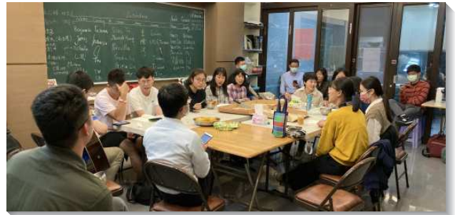
▲訓練學員配搭大學校園排

花蓮隊主要配搭當地叩門、校園開展及兒童福音。開展地區為東華、慈大校園；主要叩訪地區為美崙的民運里和民樂里。在『學禱告、學相調、學叩門』的交通中，藉著週週回訪、探視，逐漸深入當地民情，人性的顧惜帶進神性的餵養。在與聖徒們天天同心合意禱告、挨家挨戶叩訪的光景中，每個人都擺上自己的五餅二魚，在有限的時間、精力中，竭力配搭，經歷主將得救的人加給我們，並在福音朋友及待恢復聖徒家中建立家聚會、兒童排。在彼此相愛、同心合意的交通中，見證主就是道路、實際、生命，也見證生命的牧養。