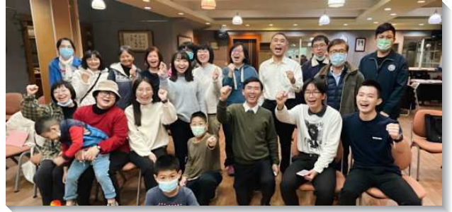
▲訓練學員與聖徒配搭鄉鎮福音開展

新北海山隊開展三峽區，開展區域共五個小區，主要分布在南大區的舊社區，以即將增會所的一區為範圍，開展方式以馬路福音、公園福音和熱門福音為主。在開展中我們與身體的關係是對的，與主的關係是對的，主就親自祝福祂的召會。學員們在第三週經過了長時間禱告，得著主新鮮的說話，並突破了與同伴的關係。在這五週裏建立了公園兒童排，並順利交接給主體聖徒，週週在公園傳福音，得著一個一個的家。開展的最後一天