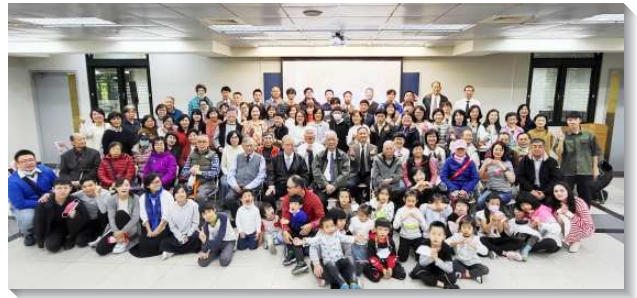
▲聖徒們同心合意帶進繁增的祝福

隨著疫情逐漸趨緩，福音聚會也逐漸回到實體舉行，各區依然週週輪流配搭，有的邀約人，有的與學員外出傳福音，有人豫備精彩的見證，有人配搭主持，每個人都盡上自己的功用。聖靈在其中運行，弟兄姊妹身旁的朋友或者接觸一段時間的福音朋友，就受浸得救了，並且有三分之二的新人仍在召會生活中被牧養。在幾次的集中主日中，都看見有新人加進來，使我們靈裏敬拜神，如同主在約翰福音十五章八節的囑咐，『你們多結果子，我父就因此得榮耀，你們也就是我的門徒了』。