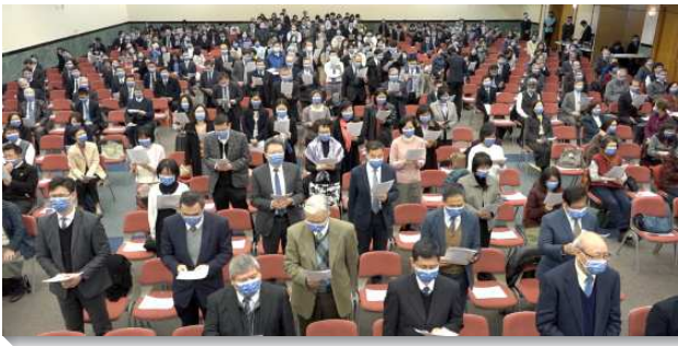
▲新春集中特會於信基大樓地下二樓舉行

擘餅聚會後，弟兄介紹台北市召會的十個大區，以及各區召會生活現況，並播放台北市召會簡介影片。台北市召會是基督宇宙的身體在台北市出現，我們的