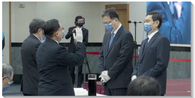
▲弟兄們於新春集中特會擘餅

認識主的恢復，首先須認識何為神的經綸。神的經綸藉著使徒們揭示出來，但因信徒失去對神的經綸之正確領會，就需要主來作恢復的工作。我們在主的恢復裏，須對神的經綸有清楚的異象，並受這異象的管