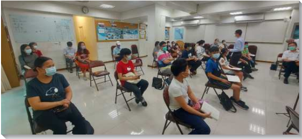
▲青少年於受浸聚會中喜樂受浸

——十六會所有一批升小六和國一的青少年，渴慕——同受浸歸主。然而去年五月，因著台灣疫情爆發，政府限制宗教場所無法實體聚會，聖徒不知道甚麼時候才有機會為孩子施浸。直到八月初疫情逐漸緩和，政府有限度開放聚會，正巧從這批兒童小時候就陪伴他們兒童排的服事家，恰好從德國開展回台探親，他們的兒女就邀請同伴們一起受浸，好歸入主耶穌的名裏，跟隨召會羊群的腳蹤，被成全與牧養，成為基督身體上的受成全且盡功用的肢體。