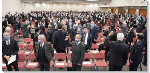
▲各大區聖徒參加新春集中特會

緊接著，再有主的恢復歷史與簡介影片。主的恢復乃是回到聖經中關於神的經綸這中心的啓示，過去兩千年因著人的觀念，使神聖啓示被蒙蔽。但在召會歷史中，神仍一直在作恢復的工作，恢復就是找回聖經中基督徒該有而失落的真理，這恢復的水流在二十世紀初流到了中國，倪柝聲弟兄是主在這時代恢復的工作所興起的獨特恩賜，他呼召神的兒女回到神中心的旨意，以基督為中心，並強調基督只有一個身體，顯為各地的地方召會。至一九五二年，至少有五十餘項重要的恢復，藉倪柝聲弟兄揭示並恢復。其後李常受弟兄傳承倪柝聲弟兄的職事，並將其發揚光大，至今主的恢復仍在全地擴展。