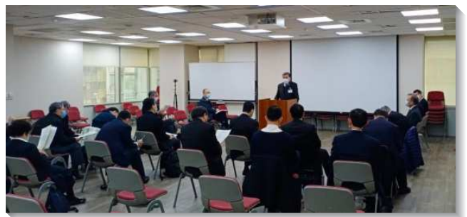
▲ 聖徒們在成全訓練中分組交通

第二篇『成全人，將人構成爲主的門徒，並走牧養的路得復興』。主在馬太福音二十八章十九節對門徒說，『所以你們要去，使萬民作我的門徒，』爲將外邦人構成基督的門徒，我們需要先被主構成門徒，然後再成全人成爲門徒，而這成全的路就是藉著牧養。