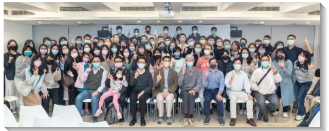
▲五個會所的青職聖徒一同出外相調

下午則走訪北投地區的景點，並安排所學背景相關的青職們，分別作人文、歷史、建築、地質導覽，使青職們得以發揮所長。盼望藉著身體相調與福音行動，帶進更多的青年人，使召會繁增。（王宏豪）