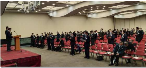
▲ 全台同工成全訓練在信基大樓舉行

成全訓練的信息有三個系列，第一系列是真理，第一篇為『我們必須進入新時代，學習神話語中高品的真理，學習以新的方式講說主的話』。因著真理的釋放，主在祂恢復的行動上改了，我們若沒有進入新時