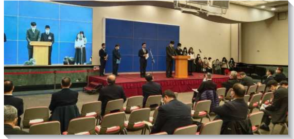
▲ 聖徒們在成全訓練中分享

第二系列是生命，分爲兩組，第一組爲五十歲以上的同工們交通，要幫助所接觸之人在生命中長大，不是用道理、經驗而是憑講說高品真理；爲此要積極跟上時代，學成全，也學開展。第二組爲五十歲以下的同工們，認識我們都是蒙主呼召，要顯出功用，有所