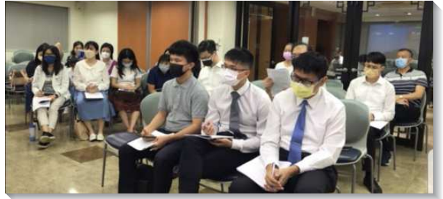
▲台北場聖徒於國殤節特會中專注聽信息

第五篇帶我們看見『過基督徒生活成爲得勝者的祕訣，走喫基督並享受基督作生命樹的路』。神沒有一點意思要我們爲祂作甚麼，祂惟一的心意是要將祂自己當作食物給我們享受。惟有那些走享受基督作生命樹之路的人，將看見他們的生活和工作存留於新耶路撒冷。我們能喫主耶穌作我們屬靈的食物，供我們享受，接受祂這賜人生命的靈，乃是藉著各樣的禱告並