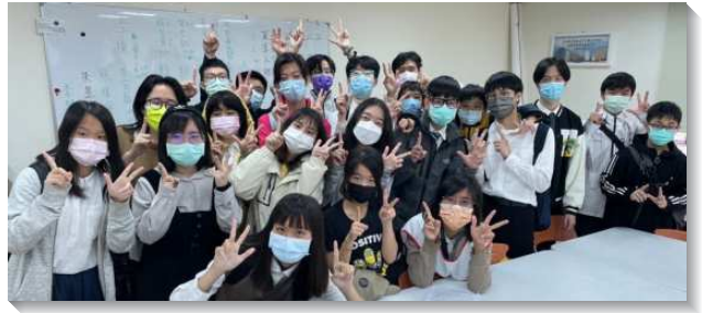
▲學生們操練靈領受負擔牧養人

福音豫備上，服事者陪伴學生中幹，領受負擔、學習傳講人生的奧秘、主日傳輸負擔並執行週計畫，帶領學生建立傳福音的生活。高中中幹開始陪伴國中生每週有一對一的家聚會，使學生們彼此牧養，亦使整個區聯結得更緊密、更同心合意。藉著這學期四個月的豫備，當日與會福音朋友有二十九位，受浸六位，都是聖徒的孩子，隔週的青少年排也陸續約到同學再次來赴會。現今學生區主日人數與期初相比，穩定增加三至五位，盼望之後，能帶進更多青年人得救，同過召會生活！