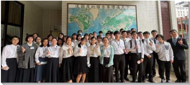
▲各大學聖徒參加夏季現場訓練

第七篇則說到，為著成為神建造的材料，我們也需要經歷基督的死、基督的復活、與基督作為那靈。聖殿的門乃是用松木作的，其上刻著基路伯和棕樹表徵基督的得勝和主的榮耀已經藉著受苦雕刻到我們裏