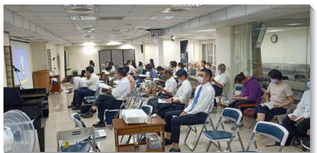
▲聖徒們至會所參加夏季現場訓練

自七月二十三日起，連續二週週六、主日有信基大區現場訓練，本會所以線上直播方式同步進行，除了有弟兄們釋放職事話語外，每堂亦有聖徒操練分享。雖因是現場訓練，不開放線上參加，每堂仍平均有聖徒五十七位，其中青職十二位參加。本次訓練最末一篇提到，在生命中作王要受神的話教導、管制、規律並支配。每次冬夏季訓練都是屬靈的節期，幫助聖徒們被主話浸透，藉此受教育、被構成，經歷在生命中作王，過得勝的生活。（郝家銘）