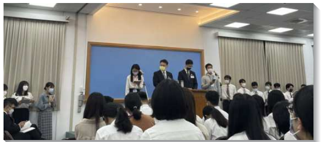
▲大學聖徒於夏季現場訓練中分享及考試

訓練的末了有為著學生及服事配搭人位的湧流申言聚會，眾人展覽在這十二篇信息上的耕耘與經營，帶來豐富的出產供眾人分享。正如信息中所提到的：『所有信徒都得救成為君王和祭司；當祭司為神說話時，他們就成為神的代言人，這些人就是申言者。…申言乃是得勝者的功用』。學生們踴躍的上台分享，