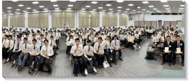
▲大學聖徒夏季現場訓練於三會所舉行

本次訓練更盼望學生不僅在聚會中操練靈，回到寢室內也學習憑著調和的靈生活，藉著個人、團體內務的操練，加上表單的輔助，以建立真、準、緊的性情，同時與其他校園的大專生晚禱相調、共同豫備考