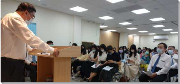
▲聖徒們參加下半年事奉交通聚會

會中弟兄們提到列王紀中，以利沙緊緊跟隨那有時代異象的以利亞，我們也應當緊緊跟隨從現今的時代執事所領受的異象：人人成為新約福音祭司，走神命定之路—生、養、教、建（生機工作的四步）。