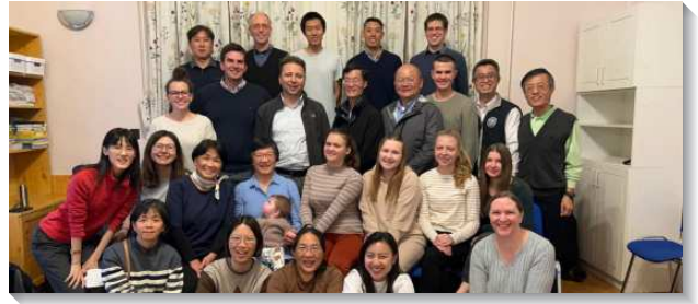
▲ 各地聖徒至東歐配搭傳福音

我們在車站裏遇到一位媽媽，她帶著三歲孩子要回去仍遭受轟炸的家鄉尼古拉耶夫，照顧生病無法行動的父親。我們幫她指引路並提行李。試想一個弱女子，當初是如何帶著孩子和這些家當逃出來？她一面走一面還頻頻回頭看，似乎不敢相信我們這些人會真的這麼好，並不是要從他們身上得什麼東西。終於一切就位，她流下