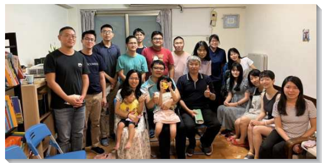
▲聖徒與學生配搭一同牧養大學生

此外，各區聖徒於主日會後，或在會所旁，或在校園周邊接觸青年人，盼能帶領他們接受救恩。若有做