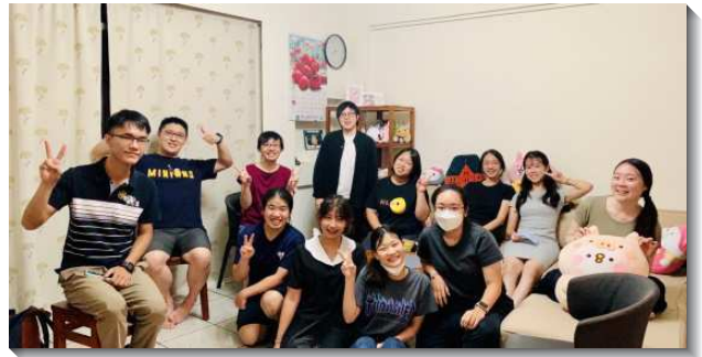
▲大學生受聖徒牧養在召會生活中

此外，藉著每週主日晚上的師大聖經講座，許多初信的小羊和福音朋友們都會前來，照顧家得以在用餐時，和受邀約的朋友們建立關係，後續就可以直接和他們聯絡並照顧，不管是前去宿舍看望，或是邀約到