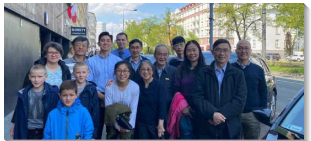
▲ 聖徒們配搭至東歐傳報大好信息

關懷包中有雷瑪出版社的小冊子—『基督徒的基本元素』第一冊，職事解開的話發揮了很大的功用。有一次，有位女兒與媽媽問到，『我們讀了你們的小冊，非常喜歡，請問有第二冊嗎？』盼望我們都為此禱告，讓『神所栽種，歷代以來就在運行的一種要有目的的感覺；日光之下，除神以外，別無甚麼可以滿足這感覺』，能在他們裏面加強運行，使他們能打開它來讀、並被裏面的話所摸著，就做開全人、從深處向主呼求禱告，這就開始了接枝的生活。阿利路亞！