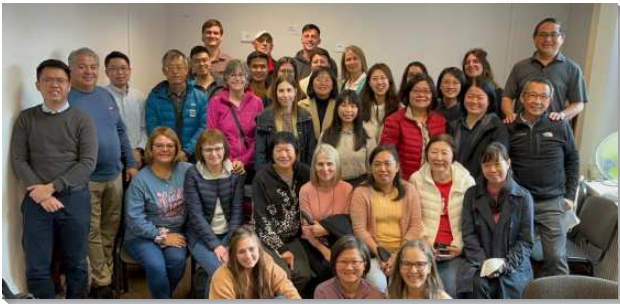
▲ 聖徒們一同配搭至東歐傳福音

弟兄們向全球眾召會發出呼召，要在波蘭的Warsaw, Krakow, Wroclaw, Przemysl；斯洛伐克的Bratislava、Kosice；匈牙利的Budapest；羅馬尼亞的Bucharest，藉著身體的力量、分送關懷包，向難民傳揚國度的福音。對著這群身心靈俱疲的人，我們需要如好撒瑪利亞人（路十30~37）的複製和翻版，把主再次活在地上。