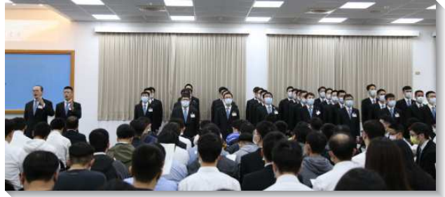
▲全時間訓練學員展覽詩歌

在三場聚會未了，皆有訓練教師給青年聖徒勸勉與鼓勵。一位教師說到，我們要有分於神的建造，纔能看見神的榮耀，並且這個建造需要有往前，要從缺乏扎實根基的帳幕往前到在美地上的聖殿。教師也藉著