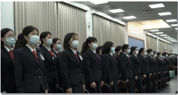
▲全時間訓練呼召聚會在三會所舉行

本次呼召聚會的主題為『奉獻作神尊貴材料，有分宇宙榮耀建造』。神渴望一個活的建築，作為盛裝並彰顯祂的器皿，將祂輝煌的照耀出來。當召會被建立起來時，就將天上的神帶到地上，並且當人來到召會中，就看見榮耀之神的顯現。近年來世界局勢劇烈變動，環境看似滿了撒但抵擋的手，但主建造的工作從未停止，甚至不斷的擴大。主今日的工作仍在繼續，祂仍在尋找一班願意與祂配合的人，成為祂在地上的居所。為此，我們需要豫備好，受主成全，使基督身體的實際出現，完成祂宇宙的建造，終極完成於新耶路撒冷。