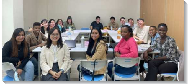
▲北醫學生聖徒邀約外籍生一同聚集

為鼓勵新人能有分主日聚會，會所亦增加主日晚上夜間擘餅前的晚餐服事，使新人能來用餐相調，並準時赴