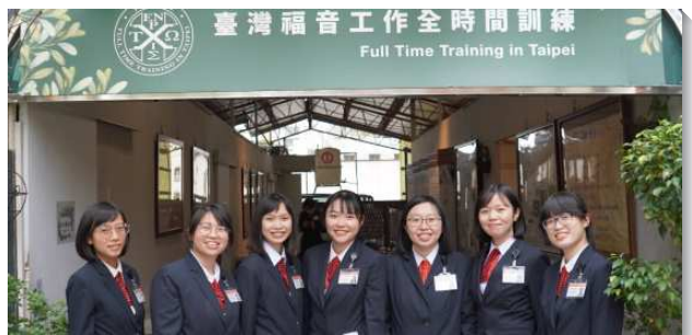
▲全時間訓練學員配搭服事

列王紀中所描繪聖殿的圖畫，向我們陳明每項聖殿材料的意義。聖殿的門是用松木作的，說出我們若要成為帶人進入召會生活的入口，就需要經歷釘十字架的基督。至聖所的門則是橄欖木作的。我們在聚會中申言能否供應聖靈，並將人帶進至聖所，全在於我們是否過接枝的生活以及經歷膏油塗抹。銅柱立在聖殿前的見證，表示我們需要經歷神的審判，以致事奉上不再是我，乃是基督，並顯出生命的豐盛。殿的根基是石頭作成的，需要先被鑿成，除去所有的稜角，好與人配搭在一起。因此，聖殿的建造從至聖所到柱子，其材料從木頭至石頭，每項都是說出這位經過過程並終極完成的三一神，要作到我們裏面，在我們身上有更多的製作。要成為這樣的材料，就需要經過訓練，使我們適合被建造在一起，成為神的居所。