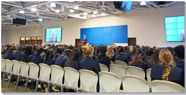
▲七月半年度訓練在美國安那翰水流職事站舉行

第一至第三篇是出自於馬太福音。第一篇說到基督作為『大光』照亮那些坐在黑暗中的人；基督作為『有權柄者』乃是因著主是一個在權柄之下的人；基督作為