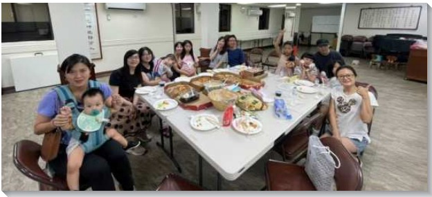
▲聖徒們喜樂配搭兒童排

在三月北市兒童家長與服事者事奉相調聚會中，弟兄們加強開家的負擔，且有各大區的兒童福音見證激