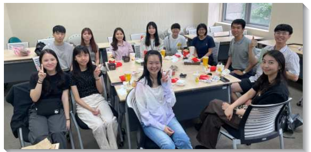
▲大學聖徒參加校園小排

當我們第一次豫備校園小排時，我們不知道要唱什麼詩歌，不知道該如何配搭，也不知道該供應人什麼話。但創世記生命讀經的話應時的鼓勵我們，看見生命樹的原則乃是倚靠，因著我們什麼都不會，無法倚靠任何老練的人，就謙卑的來到主面前向祂禱告，並完全倚靠主的帶領。藉著一次次交通前的禱告，實在