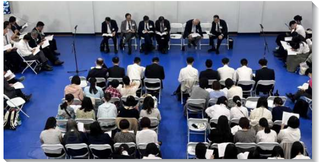
▲聖徒們赴美參加七月半年度訓練

第四篇為『國度是征服背叛，也是主耶穌的變化形像』，主耶穌就是神的國，征服背叛、擊敗撒但並抵擋反對和攻擊。祂也要在我們裏面變化形像，將我們帶進國度實際的經歷中。第五篇『享受基督作為新約禧年的實際』，路加四章禧年的宣揚控制整卷路加福音的中心思想。在新約的禧年裏，信徒已經歸回神，就是他們所失去神聖的產業，並且從一切捆綁得釋放，回到召會。