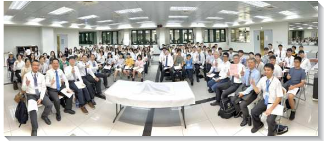
▲士林大區青少年暑期特會

在每篇的信息時間中，也安排青少年服事者作見證，服事者見證他們如何從無心變爲有心，如何從有心變爲有用。也分享到如何聖別主日聚會的時間，放下自己的追求，不是追求成爲在世上有用的人，乃是成爲『對神有用的人』。這些經歷就如詩歌所說『我