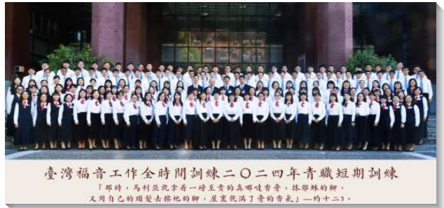
▲二〇二四年青職短期全時間訓練

在事奉一面，訓練成全學員們操練傳講『人生的奧祕』，並實際的走到馬路上開展。有些學員從來沒有以此方式接觸人，但是藉著榜樣的激勵和同伴的扶持就有了突破，也嚐到傳揚福音的喜樂。此外，訓練中心也在七月十三日舉辦一場福音聚會，鼓勵學員們積