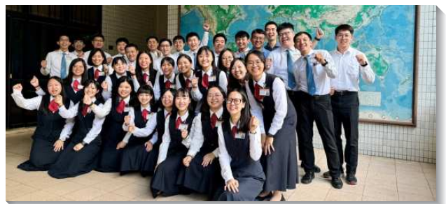
▲全時間學員陪伴青職聖徒參訓

在心志一面，訓練中心邀請了三個家向學員們分享他們已過赴海外開展的見證，其開展的國家分別是衣索比亞、迦納和印度。弟兄姊妹見證主在全地的需要是大的，在我們所不熟悉的地方，有許多人渴慕這分職事，因此需要有人將這分職事的豐富帶到他們那裏去。學員們也看見弟兄姊妹的榜樣，他們看見聖靈的水流，就願意踏下信心的腳步，到環境、語言、文化不同的地方，經歷主活的帶領，有分主在那地的工作並建立召會，學員們都相當得著激勵。