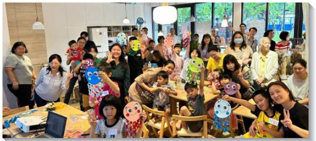
▲聖徒們配搭兒童福音

福音行動，信基大區有十三個會所，以每週兩個會所爲單位，一同扶持課程並積極有分福音的傳揚，身體的配搭是強力的後盾。也有聖徒週週都來配搭，在會中配搭兒童家長的教育課程，增加許多親子間的互動。有的區的聖徒全區總動員，一同配搭邀約人並在手作時間陪伴人。有年長的聖徒帶自己的孫子前來，並一起在公園邀約人、更豫備點心和造型氣球。還有聖徒自製手工糕點給兒童和家長享用。盼望藉著兒童品格園接觸更多的兒童及家長，並能持續回訪他們。