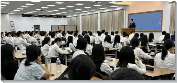
▲弟兄向學員分享海外開展的見證

本次訓練在真理一面安排的課程包含『三一神』、『神的經綸』以及『聖經研讀』。在課程中，教師幫助學員們查讀紙本聖經，藉著聖經中的話來將真理解開，並在課後上台操練向人講說高峰真理。學員們也見證，這些課程使他們認識自己以往的追求不彀扎實，願意奉獻過天天追求真理的生活而得著裝備，並盼望能彀將高的真理供應給人，因為惟有高的真理能使人向主絕對。