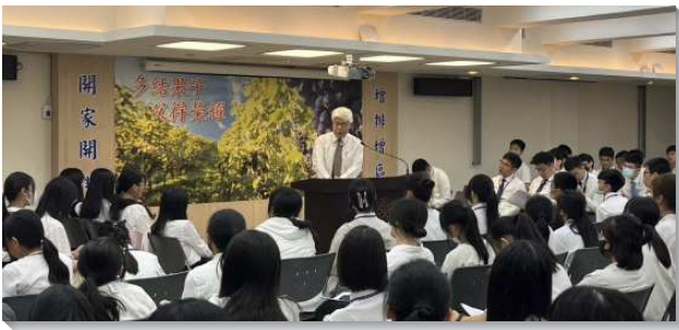
▲北投大區青少年暑假特會

第一篇信息讓我們看到人被造的目的是為著彰顯神、代表神，與施行神的管治。第二篇信息讓我們認識靈並建立操練靈的習慣，使我們的靈成為全人的領導器官。最後看到操練靈的功能與結果，乃是意志被征服、情感受平衡、心思清明健全，至終改變我們這個人，使人在我們身上看見神。