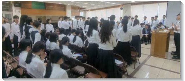
▲ 青少年靈裏火熱操練申言

許多學員剛來到訓練時都害怕申言，但一次次在同伴和輔訓的鼓勵和陪同下，原先不敢講話的姊妹，就願意操練在麥克風前分享課堂中的享受，即便只說一句話也叫人得供應。青少年在『申言』這堂課開始前，同唱補充本七三五首，當眾人一再重複唱到『說話，說話，阿利路亞！我們都能說話。』大家的靈就被激動起來，人人都迫切想為主說話。曾經膽怯的不再膽怯，因神賜給我們的乃是剛強的靈。弟兄在信息中說到，申言乃是一件榮耀的事情，因神要我們為祂說話並將祂說到人裏面，目的為使人得建造、勉勵和安慰。之後學員們個個