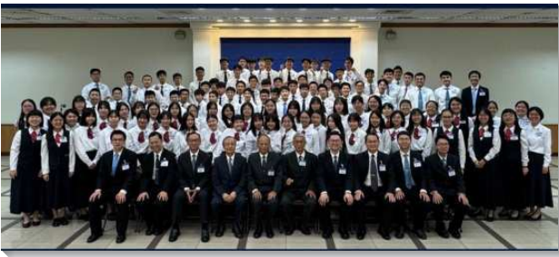
▲ 全台高中一週成全訓練—基隆場

訓練期間，受訓的學生們每日早晨五點半起床，起床後，操練先呼求主名，在一天的起頭將心對準主。接著在準確的時間內抵達指定場地，開始團體晨興，藉著唱詩及禱告，眾人的靈都被挑旺起來。學員們在吃早餐時，也會彼此分享晨興時的摸著，這激勵青少年奉獻要過天天晨興，享受主話的生活。