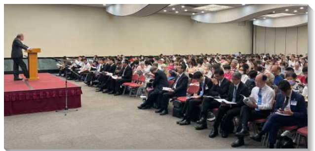
▲信基大區夏季現場訓練

在最後一堂聚會中，弟兄鼓勵聖徒們要藉著經歷耶穌的靈，同魂與福音的信仰一齊努力，並在下半『全然放膽宣揚神的國，並教導主耶穌基督的事，毫無阻礙』（徒二十八31）。（劉遠見）