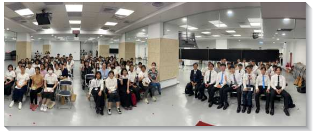
▲港湖大區青少年暑假特會

最後一天的展覽聚會中，青少年操練講說神的話、分享所經歷的基督、並向主有更新的奉獻，要成為發光體，脫離世界的霸佔與捆綁。願主得著這班青年人，與同伴竭力奔跑屬天的賽程，以贏得基督為獎賞，作轉移時代的得勝者！（劉翔恩、黃新名）