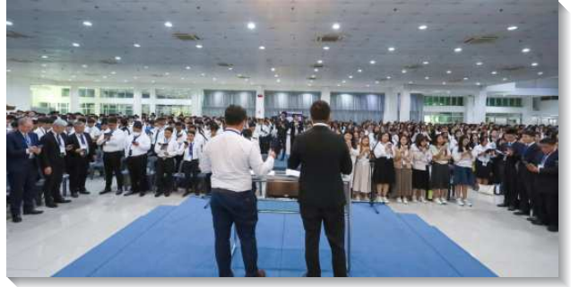
▲ 各國大學聖徒參加國際亞洲大專訓練

還有一位學生分享第七篇的信息『生命的糧』。主耶穌親自成為食物，為要讓我們喫祂並享受祂，然而我們卻常常忽略祂，沒有喫祂並享受祂。也不顧到主的心意，反而去享受人認為好的，其他屬世的事物。聽到這話時，心中實在蒙主光照。主是這樣的愛我們，渴望我們得著祂，我們卻時常違背祂。是主的憐憫，使我們能活在神的家中，有分這位包羅萬有的基督。願主保守