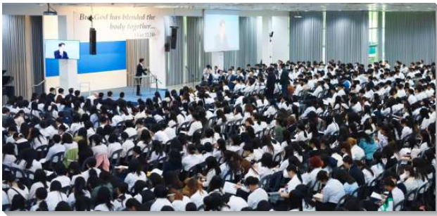
▲ 國際亞洲大專訓練在菲律賓舉行

這次訓練進入半年度訓練的內容，總題是『經歷、享受並彰顯基督』。每天三篇信息，四天共十二篇信息。信息之外，早晨還有團體晨興的時間，以及三堂分組研