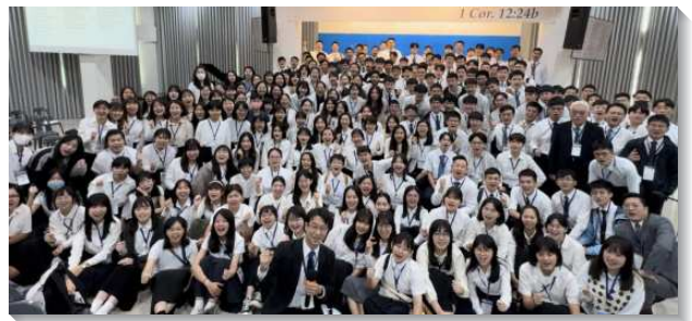
▲ 來自亞洲大學聖徒們相調為一

其中一組行程到Bulacan主日聚會。聚會中以不同語言—菲律賓語、韓語、中文讚美主，敬拜父。雖然聖徒們來自不同地方，但實在是見證我們在一個新人裏聚集！第二天一早前往Avatar Gorge觀賞當地奇妙的景觀，我們