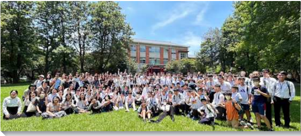
▲大安、城中、大同中山區中學生暑假特會

重器皿』、『作主湧流管道』兩個專題，及『詩歌歡唱』聚集。在『作主貴重器皿』專題中，弟兄交通這時代的王撒但無所不用其極的扭曲、破壞青年人，但主恢復中的青年人要逃避私慾，分別為聖，潔淨自己，作主貴重器皿。在『作主湧流管道』專題中，高中弟兄們見證他們如何在校園中傳揚福音、作主的見證人，更有一位青職姊妹分享她在高中時期帶九位同學得救的經歷，叫眾人得著激勵。『詩歌歡唱』聚集中，弟兄們帶唱一首首詩歌，大家享受救恩之樂以及神聖生命的湧流。