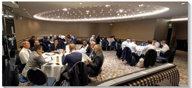
▲各地長老暨負責弟兄分組交通

末了兩篇信息的負擔是帶進神的國（太六10）。屬靈爭戰乃是神的國與撒但的國之間的爭戰，召會的職責就是繼續基督所作那抵擋撒但的得勝工作。我們需要甘心獻上自己，從事屬靈的爭戰以擊敗神的仇敵。我們也需要看見，父已經『拯救了我們脫離黑暗的權勢，把我們遷入祂愛子的國裏。』（西一13）我們這些國度的子民，活在神愛子的國裏，是要在地上實行父的旨意。我們要讓基督居首位，使我們的基督徒生活和召會生活有徹底的改變。最後，我們必須跟隨羔羊（啓十四4），