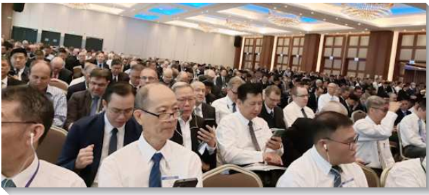
▲秋季國際長老暨負責弟兄訓練在波蘭華沙舉行

前二篇信息從神聖生命的角度論到神的國。神的國乃是神聖生命的範圍與神聖種類的範圍。神的國是由神的生命所構成的生機體，作為神施行管治的範圍，在其中祂以祂的生命掌權。信徒乃是接受神作生命並得著神自己，而進入了神聖生命的範圍；並且藉著重生，人在生命和性情上（但不在神格上）成為神，進