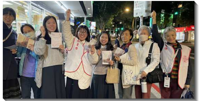
▲聖徒到社區叩門傳福音

訪里長，里長們的回應都是正面積極的，也答應儘可能將得榮少年獎助學金的申請單送到需要的里民朋友家中。我們盼望藉著關心陪伴得榮少年的家庭，將福音帶進社區，將神聖的生命供應給人。