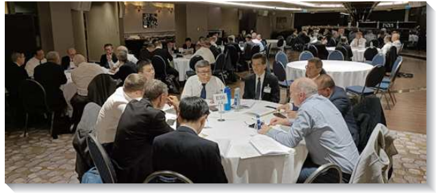
▲長老暨負責弟兄在會中交通

第五篇信息從國度所含示的寶座與權柄，看見活在神主宰權柄之下的異象（羅九19~23）。我們不該抗拒祂的定旨，而該讓祂有完全的權利，使我們被作成蒙憐憫的器皿以盛裝祂，使祂的榮耀得顯明。我們也要照著神