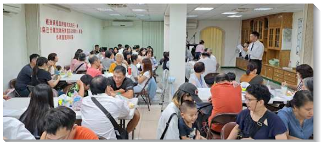
▲聖徒配搭福音餐廳愛筵

們成全人如何配搭帶詩歌、作見證，以及如何傳福音，操練福音短講。特別是成全青年人，讓青年人有更多機會來服事。因此幾乎稍微有心事奉的青年人，都有機會一同操練、配搭。