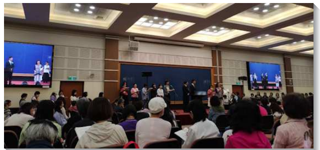
▲ 全台姊妹在事奉特會中踴躍分享

另外，在第一個晚上的專題交通為『推動進入生命讀經』，推動生命讀經研讀四個方向：人人、天天、共追、循序漸進。而具體的實行則是：第一要普遍，第二