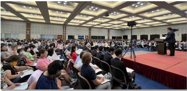
▲ 全台姊妹事奉相調特會在中部相調中心舉行

第一篇信息『神的國—神聖生命的範圍以及神聖種類的範圍』說到，神聖的生命有生命的感覺，我們順從生命的感覺就能活在神國的實際裏。有神的生命和性情纔能進入神聖種類的範圍。第二篇說到『藉著過隱藏的生活而過國度的生活』。神聖的生命有一項很特別的特點，就是隱藏，我們要學習主的榜樣，祂在行完神蹟之後，獨自上山去禱告而不留在神蹟的結果裏。我們也需