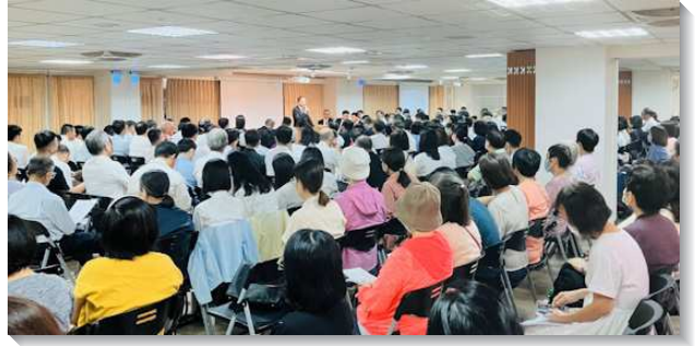
▲得榮少年關懷者下半年相調聚會

雲嘉一處召會，因著得榮少年專案，帶進召會生活的繁增。聖徒看到少年們出現，都非常喜樂。雖然少年來聚會常是在滑手機，但關懷者們仍然接納與包容，因此