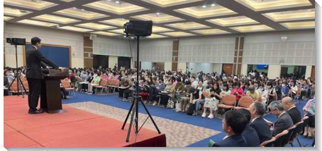
▲ 全台姊妹們熱切參加事奉相調特會

第五篇說到『活在神的主宰權柄之下並照著神的憐憫而活』。我們要看見神主宰權柄的異象，神是主宰一切者，是窯匠，對我們有絕對的主權，使我們成為貴重的器皿。也要看見神的屬性—憐憫。要仰望主的憐憫，一切在於神的憐憫。第六篇說到『在生命上儆醒並在服事上忠信』。在馬太福音二十五章一至十節可以看見國度子民，有雙重身分—童女與奴僕。一面要分分儆醒，付代價買油，就是那靈；另一面要天天作良善忠信的奴