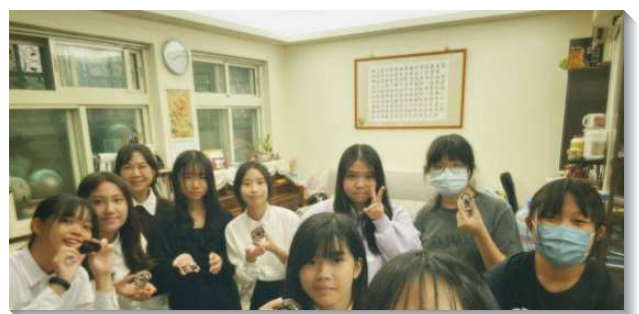
▲學生領受負擔邀約同學參加小排

學生們早上從團體晨興操練靈開始，晚上則是共同追求生命讀經，就寢前以禱告感謝作為一天的結束，整天過得充實又喜樂。盼望這些弟兄們藉著不斷的操練，至終成為主手中合用的器皿。（陸明威）