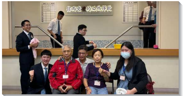
▲學員的外祖父母當日在三會所受浸

最後，有弟兄分享福音信息，以真葡萄樹這幅圖畫，說出我們應該接枝在主這真葡萄樹上，享受祂的生命，