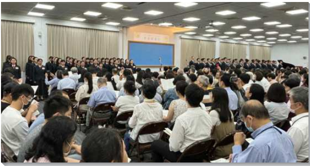
▲家長開放日中訓練學員展覽詩歌

聚會開始前，學員們在門口以詩歌熱切歡迎每位家屬及聖徒們的到來，並引導家人參觀學員們在訓練中心日常生活的地方。首站來到學員的寢室，方正的棉