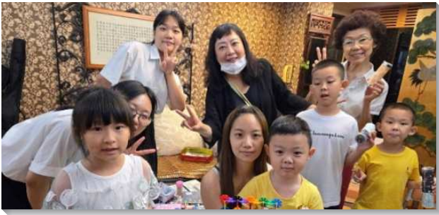
▲參加兒童排的家長受浸得救

五 十五會所的學生青職區今年承接文二、三大區的負擔，恢復『屬靈一二三』的實行。藉著與學員在校園及馬路上的開展，迎來了一次新的復興，也擴大了各個聖徒的接觸面。同時，我們也響應各區都要有兒童排的呼召，憑信心在今年實施兒童排。從一開始只有一位小朋友，到現在已經有六位，並且得著兩位兒童的家長受浸得救，實在是出於神的憐憫。因著信而順從，使我們每一季都有新人加到召會生活中。