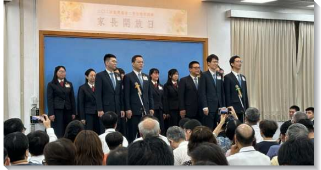
▲訓練學員向家人表達感謝

接著，有四位學員上台見證他們蒙主呼召參加訓練的過程。有的學員擁有令人稱羨的學歷、大好前程以及夢想的職業，甚至有的學員已經成家，他們仍羨慕有分於這榮耀的訓練，毅然決然先放下職業和前途，答應主的呼召。隨後，再有五位學員見證他們入訓後的改變。原本不善於整理內務的姊妹，見證她藉著訓練建立良好的性格，現在能井然有序的整理衣物。還有與家人關係疏遠的弟兄，在訓練中藉著為家人代禱，在靈中漸漸對家