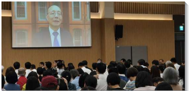
▲ 弟兄對全台兒童服事者交通負擔

第五，在小五、六銜接方面，家長需要先對自己的孩子有負擔，藉由跨區交通有更多家長一同背負，並與青少年服事者多有交通尋求，不僅有排聚會的實行，更在生活中看望並牧養孩子們，建立晨興或晚禱的習慣，使用『救恩之路』教材，引導孩子們進入並操練主日申言。為即將畢業的小六學生舉辦畢業受浸聚會，盼望他們在上國中前有得救的確信，也與國中生們一同參加國中特會，讓他們能認識青少年服事者們，並在特會裏找到他們的屬靈同伴。