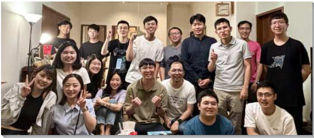
▲青職聖徒在青職排中追求聖經

『神就是愛，住在愛裏面的，就住在神裏面，神也住在他裏面』（約壹四16）。每週四晚上青職排滿了主的同在，眾人一起唱詩讚美主，再追求聖經，逐章逐節的