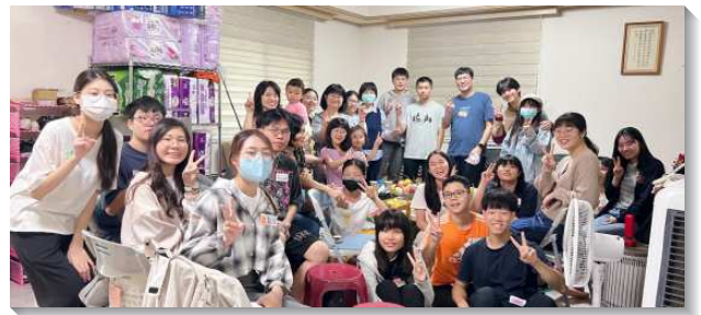
▲聖徒過喜樂甜美的召會生活

每週三學生邀請同學到聖徒家小排，除了享受詩歌、信息之外，還有社區聖徒配搭提供的美食，一起享受屬