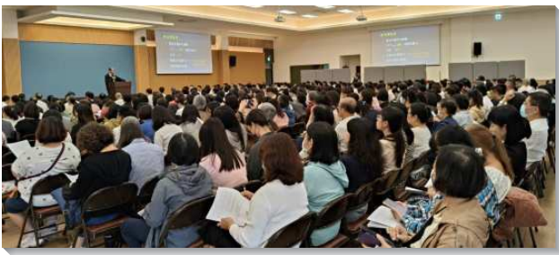
▲ 全台兒童服事交通在台南裕忠路會所舉行

本次信息主題為『充分照顧所有聖徒兒童，積極帶進大量福音兒童』。首先，對於召會生活中的下一代，需要藉著『兒童普查』，按名單逐一家訪，花時間如同『乳母』一樣充分的照顧兒童及其父母，幫助他們不僅能『聖別主日』，還能在週間參加兒童排，穩定在召會生活中。其次，在兒童福音的開展上，鼓勵聖徒打開家，邀約鄰居、親友的兒童參加，藉著社區聖徒的配搭以得著年輕的家庭，盼望台北市召會能有一萬個兒童。