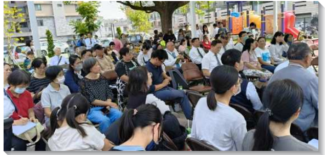
▲ 聖徒們於全台兒童服事交通中分組研討

第四，在公園兒童排方面，聖徒們藉著說故事、作氣球造型，週週到公園接觸兒童及家長，後續以『送故事