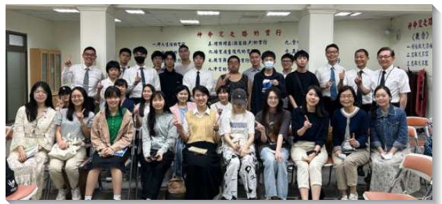
▲聖徒們配搭服事青年人

感謝主，藉著多方鼓勵，聖徒們有分年度青職特會，主在特會中的說話，大大光照並傳輸到一群大學剛畢業的青職弟兄們裏面，特會後不僅領頭操練每日進入生命讀經，更奉獻參與禱告聚會及各樣成全聚會。藉著真理裝備及神話語多方的供應，使小區弟兄姊妹無論在小排分享，或主日的申言交通中，都滿有新鮮活潑的靈，不