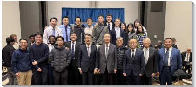
▲ 各地聖徒赴美國亞特蘭大參加感恩節特會

第五篇信息是『彼得書信中的恩典』。恩典乃是基督自己作我們的享受一恩典就是復活的基督作為賜生命的靈，將祂自己白白賜給我們，作我們的一切，並在我們裏面、藉著我們、且為我們作一切。彼得書信中的恩典包括：一、繁增的恩典（彼前一2下，彼後一2）；二、申言者豫言要臨到我們的恩典（彼前一10）；三、信徒所全然寄望的恩典（13）；四、『在神乃是甜美的〔直譯，恩典〕，』指神聖生命在我們裏面的推動，以及在我們生活中的彰顯（二19~20）；五、所有信徒所承受