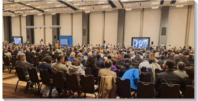
▲ 感恩節特會在美國亞特蘭大舉行

第四篇信息為『成為基督的複製品，並經歷基督作我們魂的牧人』。我們要成為我們榜樣之基督的複製品，就需要經歷基督這活在我們裏面、成形在我們裏面、並安家在我们心裏的一位（加二20，四19，弗三16~17上）。當我們成為基督的複製品，我們就可以經歷並享