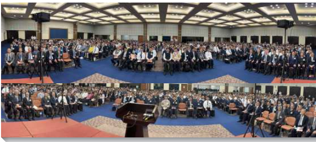
▲ 全台感恩節特會於中部相調中心舉行

全台感恩節特會信息暨禱研背講聚會於十二月四日至十二月七日，分兩梯次於中部相調中心舉行，兩個梯次共有超過一千三百四十位弟兄姊妹與會。本次特會總題是『為著神的經綸，在神的行政下過基督徒生活和召會生活』，共有六篇信息。