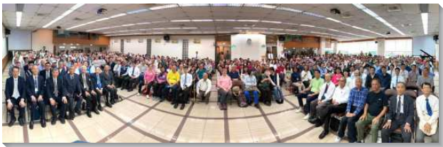
▲聖徒們至基隆一會所相調

相調聚會開始，聖徒們享受詩歌六二三首：我們呼吸天上一空氣。接著以大區為單位，聖徒們見證他們在建立晨興生活，共追生命讀經，以及實行福音牧養上所蒙的祝福。許多長青聖徒們見證，他們如何緊緊跟上召會的