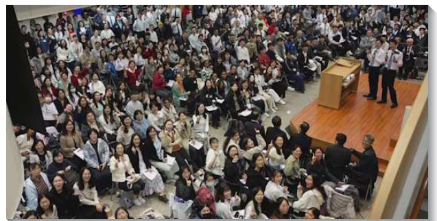
▲全台外語生相調特會在台中科園會所舉行

信息後，學生們都竭力操練分享回應。有學生分享，今天主的恢復乃是恢復基督作一切，作中心，作實