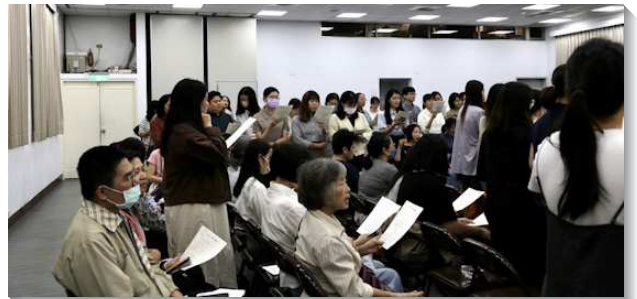
▲聖徒們參加呼召聚會

此外，教師也交通到，召會能得建造是藉著一班被成全、活而盡功用的肢體，直接建造祂的召會。神的國是神掌權的範圍，因著有一班弟兄姊妹活在國度的實際裏，召會纔會豐富，弟兄姊妹纔會長大，事奉纔會往前、有動力，召會纔會繁增，這不是理所當然，這乃是受成全的事情。詩歌三百五十五首的第三節：『起來！