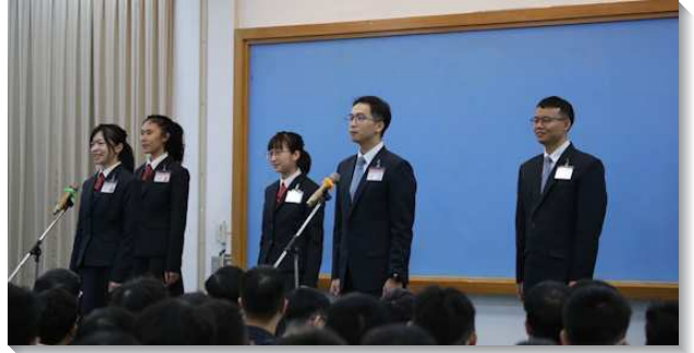
▲學員們見證蒙主呼召參加訓練

接著，教師在交通中提到倪弟兄說過的一段話：『要作人，我必須是基督徒；要作基督徒，我必須是在祂的召會裏，在祂的恢復中；要在祂的恢復中，我必須是得勝者。如果我們不是得勝者，我們就浪費了我們的一生。』主要得著一班人，在召會生活中願意過操練的生活。如同馬太二十五章所說，要作在生命上儆醒的童