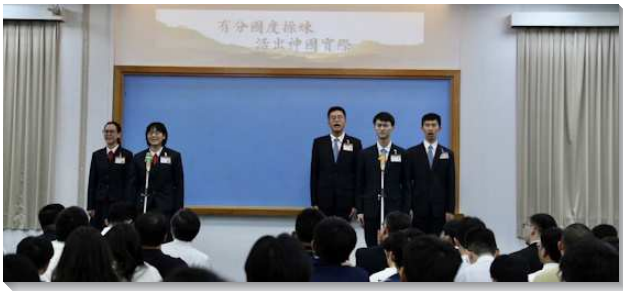
▲全時間訓練呼召聚會在三會所舉行

本次呼召聚會的主題為『有分國度操練，活出神國實際』。神按著祂的形像來創造人，乃是為使人有祂的形像來彰顯祂，並有祂的權柄來代表祂，好對付祂的仇敵。真正的召會乃是今世神在地上的國度，主要藉著得著一班人，在召會中過國度的生活，使主能將祂的掌權從天上帶到地上。今天我們需要許多的操練，使我們能活在神國的實際裏，而有分於國度的實現，就是千年國度作獎賞。我們不能不冷不熱，例行公事的過召會生活。我們必須樂意出代價，接受國度的操練，好建造召會。