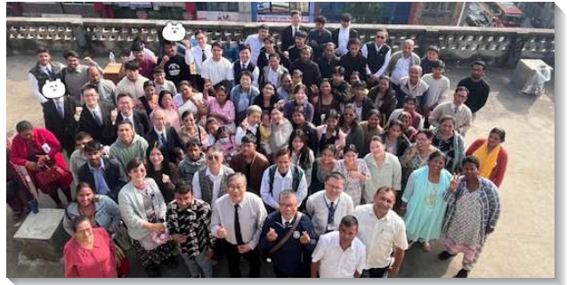
▲聖徒們參加尼泊爾全國特會

為延續特會的負擔水流，我們領受兩個主要的負擔，盼望在今年尼泊爾眾召會能繼續繁增：第一，需要恢復召會生活中，人人起來傳福音，盡生機的功用。在Lalitpur召會，除了現有的活力組生機出訪之外，去年十二月率先在兩個小區恢復了週週聖徒們固定禱告出訪的時段，我們盼望在尼泊爾建立『在新路下的召會生活模型』。傳福音、結果子是人人都該有分的，當人人都動起來，主必將得救的人加給召會！