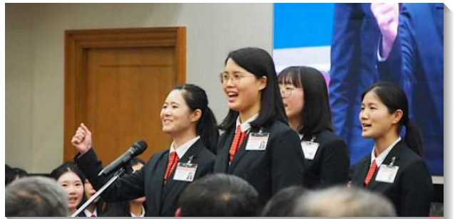
▲畢業學員分享蒙恩見證

有兩組的家長見證，他們奉獻自己的兒女，為兒女禱告將他們交在主製作的手中。兩年訓練看見主在兒女身上變化的工作，在各樣環境中更快轉向主、向主更柔軟。在他們身上看見訓練的價值跟寶貝，鼓勵青年人要竭力參加兩年完整的全時間訓練，為著主擺上自己。