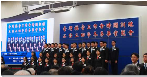
▲全時間訓練冬季畢業聚會在信基大樓舉行

聚會的開始，教師帶領學員重溫異象，說到關於全時間訓練的目的：『訓練不是學校，也不是神學院或是聖經學院，訓練乃是要輔導追求主的青年，在基督裏長大，能成為正常、活的、盡功用之肢體，使自己能被建造在身體裏，也能像有恩賜的人建造基督生機的身體』。教師勸勉每位青年人，必須操練天天、時時儆醒買油；也操練忠信的運用從主所得恩賜，成為正常、活而盡功用的肢體，過國度的生活，建造基督的身體，把主帶回來。