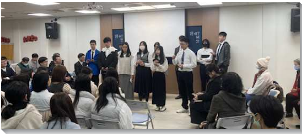
▲聖徒們於年終數算主恩聚會中分享

會所區目前有三個小排，豐富的召會生活使聖徒們對熟門福音有負擔，積極邀約鄰舍一同聚集。除了每日的晨興之外，白天的活力組禱告，晚上共同追求讀