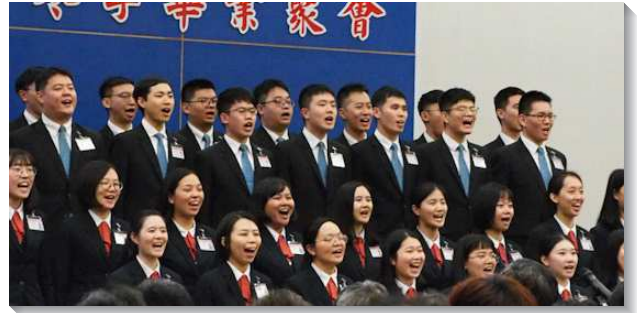
▲畢業學員展覽詩歌

詩歌後有學員的蒙恩見證，分為三部分。首先在職事和真理方面，現今在新約時代，只有一個職事、一個帶領、一個負擔，就是將基督供應給人，以建造祂的身體。學員們看見時代的職事，藉著禱、研、背、講深入現有的真理，被這職事構成。第二，在生命、性格方面，實際的學習配搭，接受神的暴露、光照和醫治。天然、怪癖、已受對付，基督更加多。第三，在事奉、基督的身體與心志方面，藉著認識神命定之路的藍圖，在生命規範裏事奉，這不在於天然的熱心，乃在於基督，並藉著與一班團體的祭司禱告將人擔負，一同事奉神。更願意奉獻給身體，藉著正確的顧到身體，不憑自己的生命，乃憑經過過程之神的生命而活，活出一個新人的實際。訓練也加強學員們的心志，為著主的回來，撇下