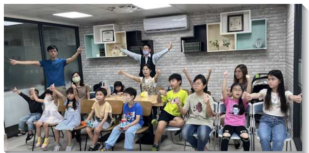
▲兒童們喜樂參加兒童排

三、生命讀經共追蒙恩：會所從前年四月開始每週追求二篇生命讀經，至今已追求完羅馬書、馬太福音生命讀經，目前正在追求約翰福音。弟兄姊妹於每週二至週五晚上線上共追半小時，逐漸被真理構成。除了線上共追生命讀經外，區負責弟兄會在主日會後，請弟兄姊妹留下來，特別是陪青職的弟兄們一同追求生命讀經。感謝主，我們能有分於神的性情，願意操練更加殷勤發展神聖的生命和神聖的性情，以豐富的進入我們主和救主耶穌基督永遠的國！（許進福）