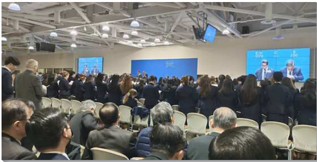
▲十二月半年度訓練在美國加州安那翰舉行

頭兩篇信息是羅馬書，第一篇是『大衛的後裔成為神的兒子』，根據羅馬書一章三至四節，我們需要認識，基督在祂的復活裏，以大能被標出為具有屬人性情之神