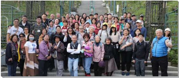
▲聖徒們喜樂外出相調

山行館及大溪橋，聖徒們欣賞美麗的景緻，並在旅程中合唱『我們呼吸天空氣』、『我愛召會生活』詩歌，聲音悠揚動人，吸引許多路人駐足。午餐後，走訪森林與觀光工廠，從大自然中體會神創造的奇妙。