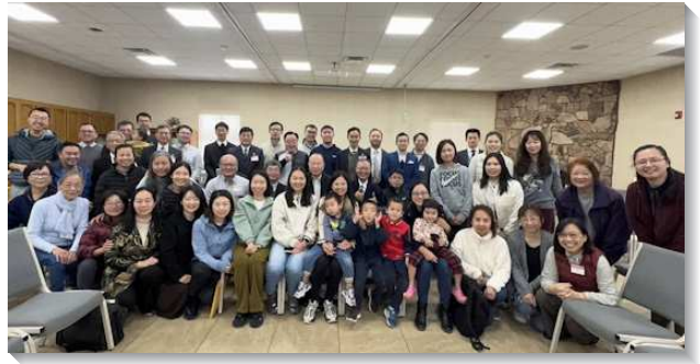
▲全球聖徒參加十二月半年度訓練

書裏，基督作為神的恩典乃是那給我們進入、經歷、享受、有分、並據有的美地，我們要構成爲新約的眾執事，為著基督身體的建造，就需要經歷哥林多後書中基督作為包羅萬有之靈的各方面。