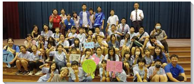
▲聖徒陪伴顧惜得榮少年

已過下半年，整個會所幾乎都動了起來，許多弟兄姊妹投入牧養得榮少年的水流當中。除了每週一同在線上晚禱，也尋找同伴同去家訪、牧養得少。每個小區週週都有家訪，不只有人性的顧惜，也運用詩歌、聖經節與牧養材料等屬靈食物，供應給得少與家長神聖的話語，使他們得著屬天的糧食。已過的一年是翻轉的一年，因著得榮少年加入召會生活，使得我們新而活。服事得少不僅是拯救青年人，也是拯救他們的家庭，更拯救我們脫離老舊的光景！雖然訪問有些得