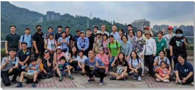
▲聖徒們喜樂過召會生活

亦有生命讀經線上共同追求，由五位弟兄姊妹輪流配搭服事讀經的追求，平均每天晚上約有六至十位聖徒上線追求。至今已讀完羅馬書，約翰福音，馬太福音，路加福音。馬可福音生命讀經也即將完成。