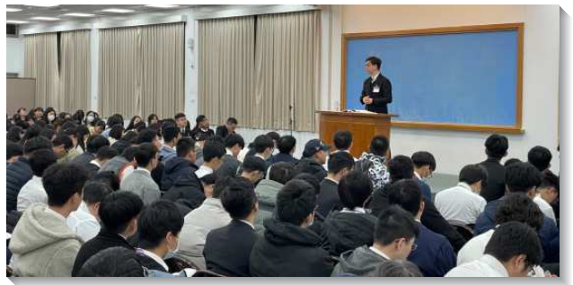
▲大學聖徒接受新鮮的說話和分賜

接續信息的負擔，本次訓練的專題交通說到實行活力排。要實行活力排，首先我們必須在主面前尋求能一起配搭的同伴，先來在一起有交通並列名、禱告。一面為人禱告，一面邀約名單上的福音朋友一同用餐。藉著在身體裏一同爭戰禱告，並且堅定持續的接觸人、陪人家聚會，就必定有人得救，並穩定在召會生活裏。最後弟兄們也按各校園、各活力組讓學生們有交通和禱告，盼望在要來新的學期裏，人人都實行活力排、作活力人，使主的身體得著擴增！