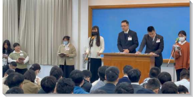
▲大學聖徒在冬季現場訓練分享

從第九篇到第十二篇，進入以弗所書，看見召會的奧祕。神所要的不是單獨的人、單獨的肢體，乃是團