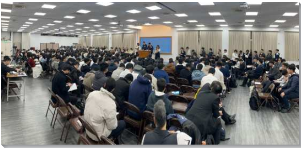
▲大學聖徒冬季現場訓練在三會所舉行

本次訓練的主題是『經歷、享受並彰顯基督（二）』，從羅馬書到以弗所書中來看，基督是大衛的後裔，是神的獨生子穿上人性成了神人，在復活裏生為神的長子，我們也在這一個出生裏成為神的眾子；藉著生命之靈在我們裏面運行，我們能在生活中經歷並享受基督，至終成為愛並成為光，就是成為神；並成為祂團體的身體，穿上軍裝與祂一同站住與仇敵爭戰。