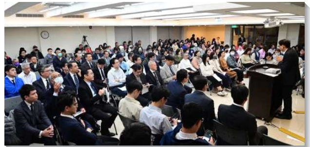
▲聖徒有分事奉成全訓練

二、普及晨興，深化禱告，借力使力，跟上水流。論到繁殖擴增，晨興與禱告是關鍵。晨興上，不僅有量的增加，更有質的拔高。每週四晨興聖言白天班、平日生命讀經共同追求班以及週六全會所晨興，藉由弟兄們在靈中的揣摩及精闢的正直分解真理的話，使聖徒們更容易進入高峰真理。為成全聖徒，除了鼓勵大家有分於北投大區事奉帶領聚會、姊妹成全訓練及青職特會等訓練，拔高聖徒屬靈看見與事奉性能。每週一更有全會所弟兄事奉團交通，加強負擔，延續水流。在已過一年，