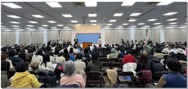
▲大安大區下半年冬季訓練於三會所舉行

大安大區下半年度冬季訓練於一月十一、十二、十八、十九日於三會所舉行，平均每場約四百五十位聖徒與會。此次訓練總題為『經歷、享受並彰顯基督（二）』，共十二篇信息。首篇即由基督是大衛的後裔切入基督之於神經綸的關係及三一身分等啓示，帶領聖徒進入訓練核心。第二至五篇解開基督帶進聖徒得勝，作為神的能力與智慧，可享受之靈食，神的