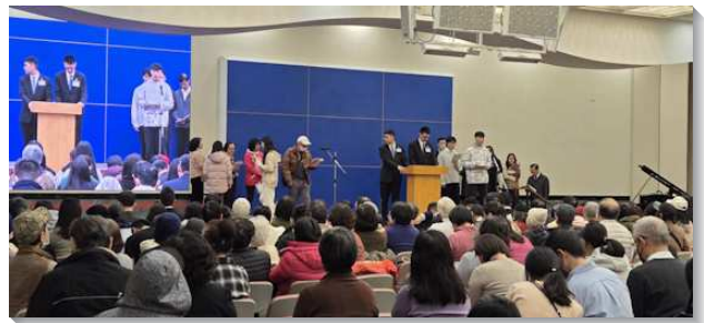
▲信基大區冬季現場訓練在信基大會場舉行

我們自得救起，就需要天天享受主的話，藉著呼求祂而觀看基督的面。聖徒們可能初期常見祂的面，然而召會生活過久了，就可能落入冷淡、老舊的情形。