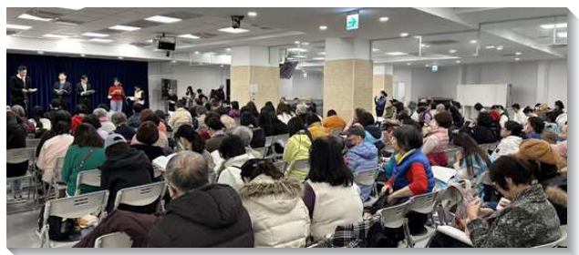
▲港湖大區冬季訓練於港湖相調中心舉行

當我們直接的接觸神自己，就能為著身體的建造被作成恩賜者，照著祂恩賜的度量，有分於身體的建造。我們需要在身體中穿戴神全副的軍裝，使我們有管治權代表祂，擊敗仇敵，使神的定旨得以成就。（楊慕綦）