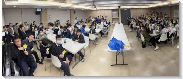
▲北投大區國中寒假特會在十二會所舉行

高中特會於一月二十至二十二日在宜蘭市召會舉辦，有四十二位青少年、十九位服事者參與。特會的主題是『人生的奧秘』，並在聚會後，眾人出外傳馬路福音接