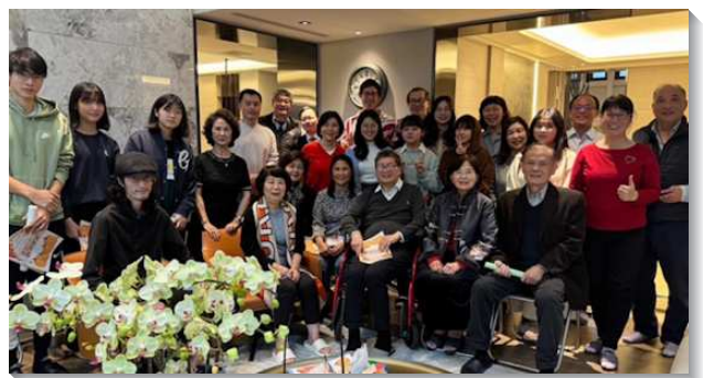
▲聖徒配搭服事大學校園

十二月，姊妹和牧養家所在的小區一起數算恩典，藉著詩歌展覽，弟兄姊妹們見證這位又活又真的主，看見召會生活的豐富，吸引她們寶愛主耶穌，要在大學四年聯於召會，過正常的基督徒生活。（黎紅漫）