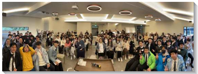
▲港湖大區中學生寒假特會

造』及『三一神與基督的身位與工作』系列信息。國中聖徒需要從小認識關於三一神的基要真理，並神聖三一之神聖分賜之異象，好與這分賜合作，與三一神是一。高中聖徒則需要看見召會的起源、產生、身份、歷程及完成，好照著啓示與主配合，建造祂的身體。兩系列的課程都總結於新耶路撒冷，青少年們同受激勵，要以神的定旨爲我們的目標。