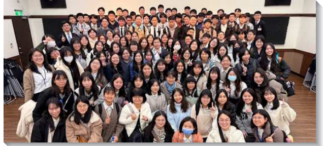
▲城中、中山大同、信基士林、文一大學期初特會

第四篇在馬太二十六章中，一個女人拿著一玉瓶極貴的香膏，澆在主的頭上，門徒以爲這是枉費，但主耶穌卻說這是一件美事。盼學生能豪邁、癡狂的愛