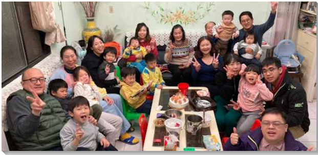
▲聖徒一起配搭關心兒童

當時全會所有三個兒童排，三個主要的家打開，也有幾個福音朋友的家幾週輪流一次。藉大量帶兒童外