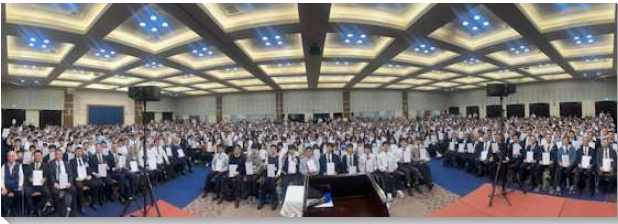
▲文二三大區成全訓練在中部相調中心舉行

第一至四篇說到『神命定之路的重要性與在神所命定之路的實行上，作神合用的器皿』，第五到七篇為『營造良好健康屬靈的召會生態與召會生活相調的實行』，第八、九篇是『神人家庭生活與事奉之建立』，第十、十一篇為『繁增之福（生養眾多）與實行活力排（得人的絕佳途徑）』，第十二到十四篇說到『增排增區之實行（全體盡功用）與事奉核心之建立』，第十五到十七篇為『得著繁增之福的內在祕訣』。每堂課末了安排兩組聖徒作生命的見證，在場者均受他們愛主、服事主的見證激勵。每場聚集許多聖徒提前入座，認真聆聽。