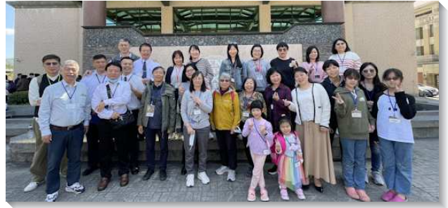
▲聖徒們有分神命定之路成全訓練

相調才能帶下主的祝福，建造的實際完全在相調，調得好，配搭得好，召會就強，度量就大，托住的能力也大。弟兄說到人若單獨難得勝，實行正確的相調就能有健康的召會生活生態，使召會能得人、留人並成全