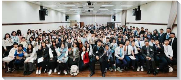
▲信基、文一大區中學生寒假特會

國中課程，首先帶學生進入認識真神、三一神的真理，神的經綸，看見三一神要分賜到我們裏面，以產生召會。最後兩篇講到基督的聖稱和身位。高中部分從神永遠經綸裏隱藏的奧秘開始，揭示神經綸的奧秘，藉著召會照耀出來。『經綸』是家庭律法，家庭行政。現今基督的奧秘已經藉著召會向我們啟示出來。此外，我們也需要認識召會的七種身分，召會的宇宙並地方的兩面，與召會地方的立場，使我們合式有分召會的建造。