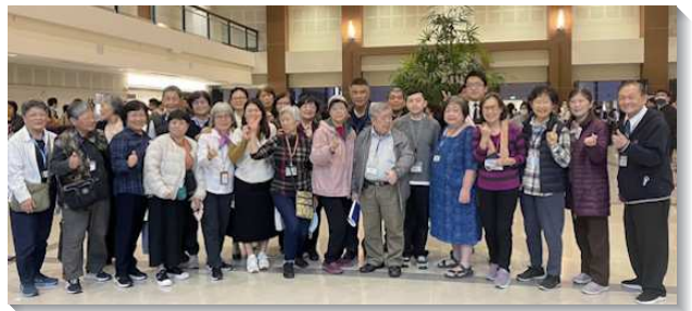
▲聖徒們參加成全訓練

所以要經歷神的同在、積極跟上聖靈的水流就是實行神命定的路，就是新路，實行生、養、教、建，全體盡功用。得著繁增之福的內在祕訣就是要有神的同在、信心的禱告、和信心的說話。惟有神的同在，纔有神的祝福，信心的禱告是有功效的，禱告是實行召會生活很有功效的路。感謝讚美主！我們的神是說話的神，神造人的目的，乃是要人為祂說話。藉著在信心裏禱告以及在信心裏說話，就能把我們帶到新路實行成功的應驗裏，好使眾聖徒都能走在神所命定的道路上。