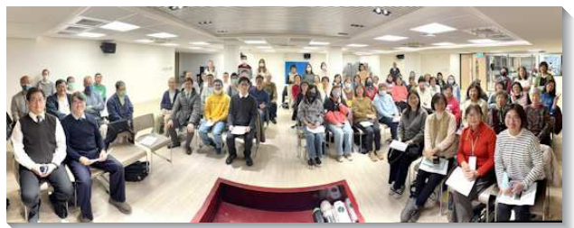
▲聖徒們參加全會所展望交通

待來訪的馬來西亞聖徒。也有聖徒第一次打開家作為主日擘餅聚會的場地。還有聖徒的配偶雖未得救，卻願意嘗試開家作為小區禱告聚會的地點。此外，也有聖徒開家愛筵人，一同配搭接觸幼幼排的家長。