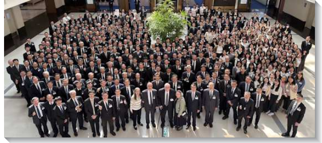
▲ 各地同工參加春季同工成全訓練

第三篇是『為著新的復興，被構成門徒過神人的生活，成為今日的得勝者』。神需要一班團體的人，藉著神聖啟示的高峰，憑著祂的恩典被興起來，過一種照著這啟示的神人生活。復興乃是我們所看見之異象的實行。我們若實行過神人的生活，這生活就是基督身體的實際，自然而然就會有團體的模型，就是活在神經綸裏的模型，這模型要成為召會歷史中最大的復興，把主帶回來。第四篇『照著主耶穌和使徒保羅的榜樣，憑顧惜與餵養而牧養人』，以完成神永遠的經綸。在神完整的