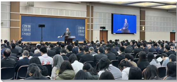
▲ 全台春季同工成全訓練在中部相調中心舉行

第一篇信息說到金燈臺與新的復興三方面的關聯。新的復興有三方面：第一是達到神聖啟示的最高峰，這是聯於金燈臺的內在意義。第二，過神人的生活，這是金