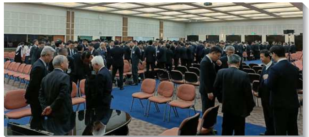
▲ 各地同工團體禱告

第五篇『藉著給聖徒屬靈洗腳的服事而牧養他們，好恢復他們屬靈的新樣、新鮮與活潑』。在約翰福音十三章所記載關於洗腳的事，乃是一個表號，具有屬靈意義的象徵。在我們的經歷中，腳的玷污指因著與世界接觸而產生與神並與彼此的隔膜；洗腳指恢復屬靈的新鮮與活潑，並恢復我們與主並彼此的交通。我們要經歷這種洗滌，就需要花時間在主面前，並與那些滿了那靈、話、和神聖生命的聖徒在一起。並且我們每個人都必須