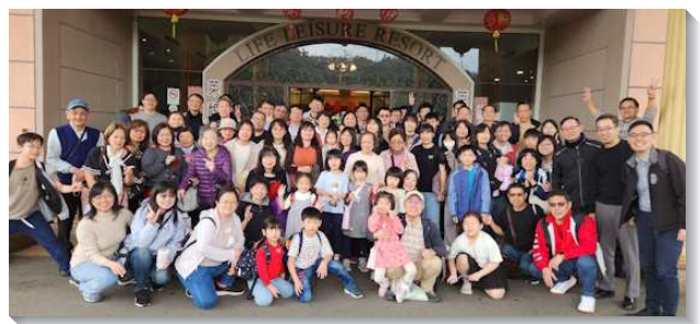
▲聖徒們喜樂參加新春集調

因著社區聖徒對學生有負擔，宣告今年要再增一個學生區，同時盼望成全更多青職聖徒一同配搭學生服事，人人付上代價，不惜遠距照顧，舉辦登山相調，用餐相調，加上追求屬靈信息，使青年人在生活中彼此作同伴，在各樣聚會中樂意盡功用，更在學生工作