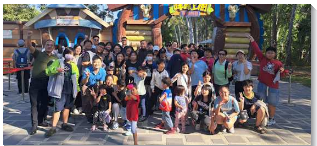
▲聖徒們牧養青少年及兒童

因爲在牧養人之前，我們需要到主面前來有禱告、有尋求。爲著我們所牧養的心上人提名代禱，也要尋求合適的牧養材料好供應人。牧養的對象也有許多的情形，但藉著一次一次的禱告，使我們能轉回靈裏，不看人的光景與處境，也不看自己的天然與難處，使我們能真實的供應人生命，讚美主。（劉舜祥）