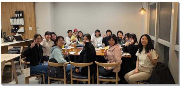
▲聖徒們與大學生配搭校園排

會所聖徒配搭服事台北市立大學的校園，爲了方便照顧校園內的福音朋友與小羊，我們從去年下半年開始在學校咖啡廳有每週一次的小排，這學期進而擴增爲兩個小排。因著地點的方便，有更多的學生願意來讀聖經，其中也有不少同學願意到會所有分福音晚餐。校園小排藉著五環一學生、社區聖徒、教職