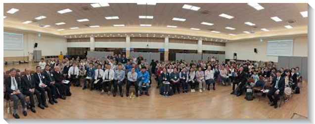
▲全台手語聖徒相調特會在台南市召會舉行

此次特會內容為華語特會信息，總題說到『挪亞、但以理和約伯—在生命線上過得勝生活以成就神經綸的榜樣』。帶我們看見挪亞、但以理和約伯的生活，啓示三一神將祂自己分賜、作到祂所揀選並救贖的人裏面，以成就祂永遠的經綸。在末了一篇信息的分享中，一位聽障聖徒終於領悟，為何他會生長在『無聲』的環境中受苦，原來是要叫他更多的『看見神』而『得著神』。因此，他願意停下埋怨，藉著享受神聖三一的分賜，而留在生命的線上過得勝的生活，以成就神的經綸。