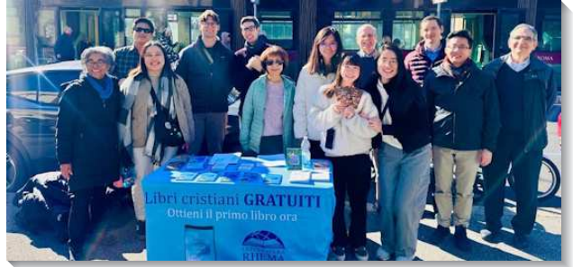
▲聖徒們至義大利配搭福音開展

這次福音行動的負擔是得著校園中的青年人，並藉著與聖徒家聚會而顧惜並餵養聖徒。我們開展的校園為羅馬第一大學，除了擺攤發送聖經書報，我們也操練一對一的接觸人。在和當地聖徒配搭的過程中，我們看見福音並非工作，而是生活，聖徒在日常生活中自然而然地