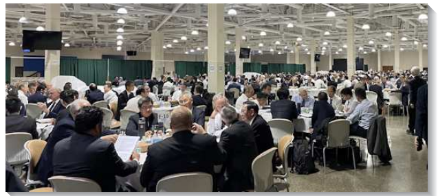
▲聖徒們在春季國際長老同工訓練中交通

第七篇『三一神將祂自己分賜到我們裏面的永遠福分，為作我們的享受並完成祂的經綸』，進一步給我們