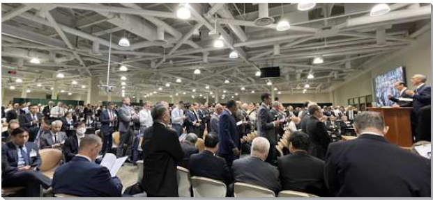
▲春季國際長老同工訓練在美國安那翰舉行

第二篇說到『和好的職事』。林後五章十八至二十節指明，新約的眾執事作基督的大使，乃是要完成和好的職事。和好的職事把我們帶回歸神到一個地步，我們能在基督裏成為神的義。藉著和好的職事，我們得以合併到經過過程並終極完成的三一神裏，而在基督裏成為神