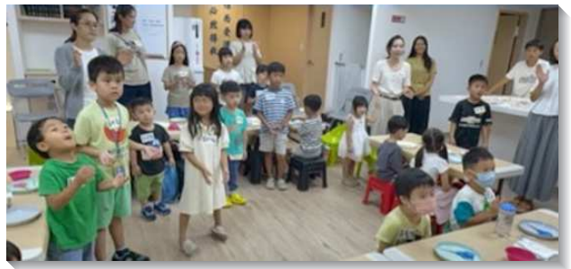
▲聖徒們邀約親子參加兒童福音行動

去年八月底新會所場地終於啓用了，透過連假，我們舉辦蝶谷巴特手作朋友日。以此為憑藉，邀約孩子們的同學和家長來到神的家。第一次使用新會所舉辦較大的兒童活動，許多安排尚未有前例可參考，且當天多位老練的服事者也無法在場，因此眾人在會前更加儆醒豫備，一同在大小事上多有禱告與尋求，盡可能周全顧到各面。除了本會所外，也有十一會所的家