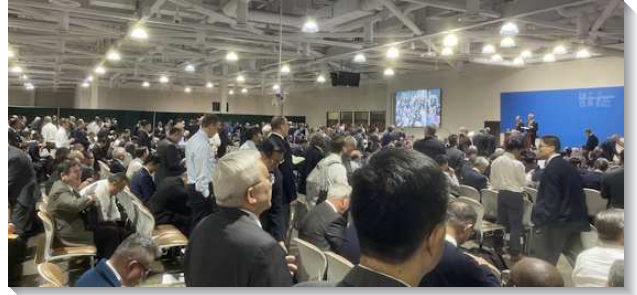
▲聖徒們參加春季國際長老同工訓練

第五篇的主題是『作主忠信的管家，有從主來的負擔供應話語，並彼此同心合意配搭，好與主合作以完成祂的經綸』。話語的職事就是神的分賜；神的分賜是為著完成神的經綸。為此，神需要忠信的管家，藉著話語的職事，將神聖生命的供應分賜給神的兒女。我們必須有從主來的負擔，在與主親密的交通中，藉著禱告來領受