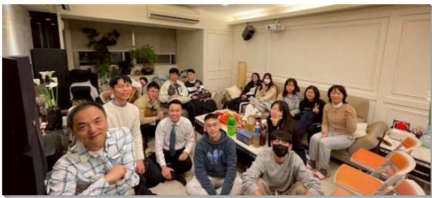
▲聖徒們喜樂開家服事大學生

本會所持續推動每月一次的挨家挨戶大專排聚會。一面鼓勵聖徒開家，跟上主今時代的行動；一面藉著眾聖徒同心配搭，逐步建立穩定且持續的青年牧養環