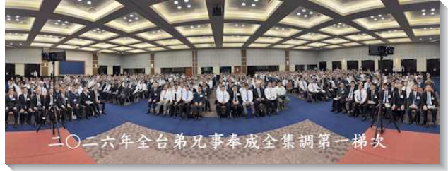
▲ 聖徒們參加全台弟兄事奉集調

要完成神的經綸，我們就要與主合作，作主忠信的管家，有從主來的負擔供應話語，並彼此同心合意配搭。在使徒約翰的職事中，他所供應的基督，是要將三一神作為生命分賜到我們三部分的人裏面，使我們成為三一神完滿的彰顯。而使徒保羅在林後十三章十四節也給我們看見，三一神將祂自己分賜到我們裏面的完滿福音，這需要我們進入並保守自己在神的愛裏，站在基督的恩典中，並在聖靈的交通裏。三一神作生命分賜到三部分的人裏，乃是根據祂的公義，藉著祂的聖別，而達到祂的榮耀，使祂這些神聖屬性，成為人的人性美德，使神得著團體的彰顯，就是在眾地方召會裏基督身體的實際，三一神的傑作——一個新人，終極完成新耶路撒冷，作為公義、聖別且榮耀的城。