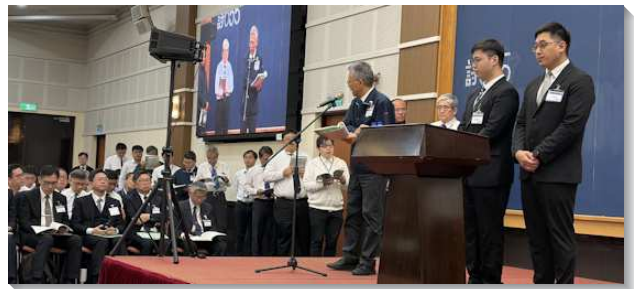
▲ 弟兄們於全台弟兄事奉集調中分享

每堂聚會信息後的分享，弟兄們非常踴躍的將主的話，供應分享給所有與會的聖徒，常常時間不敷，眾人都很得激勵。信息中真理豐富，也能非常實際的應用在召會生活中。許多弟兄見證蒙了光照，我們的聚會的話語上仍是缺乏；召會中各種的難處，也說出我們沒有活在靈中，還需要與神完全和好，一直活在至聖所裏。我們在召會的事奉中，也非常需要真實的負擔。我們常常作了許多外面的事，安排了許多活動，裏面卻缺少真實的負擔。我們需要從主來的負擔，纔能實化並實行我們所聽見的，真實的將三一神分賜給人，也纔能建造召會，帶進繁增，也產生三一神團體的彰顯。