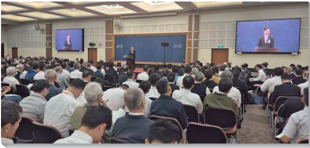
▲ 全台弟兄事奉集調於中部相調中心舉行

使徒們在行傳六章四節說，『但我們要堅定持續的禱告，並盡話語的職事。』在召會生活中，我們都該看重話語的職事。為此，我們先要堅定持續的禱告。在禱告的事上，我們都必須作個學習者，學習在禱告中接觸神、吸取神，好摸著祂自己和祂的旨意，我們纔能有權柄的禱告。我們服事話語的職事，該是新約獨一職事的一部分。新約的職事乃是和好的職事，不僅使罪人脫離