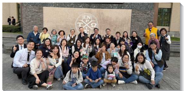
▲聖徒們至中調參加新春集調

集調結束的當日下午就傳來佳音，一位姊妹奉獻要帶鄰居受浸，聚會後同小區的七位聖徒立即驅車前往鄰居家，眾人同心合意配搭禱告、傳講，福音對象就簡單相信並受浸了！真能見證神是信實的，祂所成就的也超乎我們所求所想，讚美主。祭壇的火不可熄滅，眾人還要持續在這道奉獻的流中往前。（方婕宇）