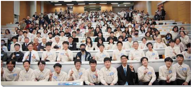
▲聖徒們參加台大台科大青年聚會

此次青年聚會，聖徒們一同配搭傳揚福音，教職員聖徒在辦公室或研究室張貼海報，邀約學生。社區聖徒邀人，青職聖徒配搭飯食、招待。學生們在會所張貼代禱牆，列出上百位代禱名單，為人代求。同時也張貼海