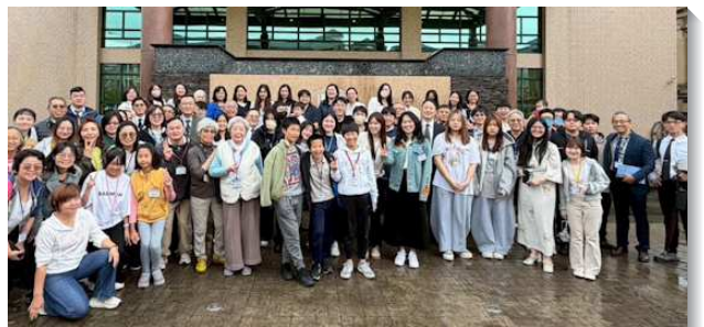
▲聖徒們有分神命定之路成全訓練

第五、六、七篇著重於實行，在培育屬靈的下一代方面，我們必須知道召會的未來在於下一代。身為家長，我們必須為兒女聖別自己，約束行為與語言，成為孩子的榜樣，有正確的屬靈教育。實行上，要積極推動社區兒童排，並讓青少年在召會生活中受成全。我們要在孩子年幼時，就將真理的種子撒在他們心裏，使他們成為主手中合用的器皿。最後，召會繁增的必要條件為神