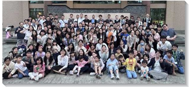
▲聖徒們參加神命定之路成全訓練

第三、四篇信息提到召會生活健康的生態：生態決定生命的繁增。例如魚需要良好的生態環境才能活得好，繁增不斷。照樣，聖徒在健康的屬靈生態中才能舒暢、喜樂、滿足、產生活力，被成全為著召會的繁增。在過程中需要除去消極的污染，比如己的個性、個人的意見以及天然的幹才，常常會造成召會生活的難處。另外，還需加進積極的素質（晨興、禱告、相調），晨興是活力的泉源，禱告是能力的來源，相調是動力的根源。我們還需要恢復挨家挨戶的召會生活，使召會生活生活化，像使徒行傳二章初期的聖徒，他們天天同心合意，堅定持續的在殿裏，並且挨家挨戶擘餅，存著歡躍單純的心用飯，讚美神，在眾民面前有恩典。主將得救的人，天天和他們加在一起。最初的召會生活都是在家中，所以我們必須操練家打開，家打開聚集是召會生活中獨特的路，能使許多邪惡的事遠離我們的家。而開家