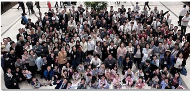
▲神命定之路成全訓練在中部相調中心舉行

第一、二篇信息著重在異象方面，實行神命定之路的終極目標，乃是為了建造基督的身體，好豫備新婦迎接主的回來。所以需要我們是個享受主、受成全、盡功用，並被建造的人。在觀念方面：看見老舊與意見是建造身體最大的攔阻，正如彼得曾受限於猶太人的傳統偏