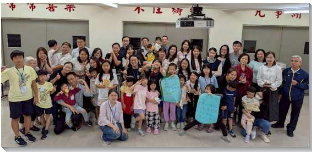
▲聖徒們喜樂服事兒童

有個長期服事兒童的家，今年搬到新住處後，住家正好鄰近國小和公園。每當打開窗戶，映入眼簾的都