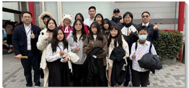
▲聖徒們多方成全青少年

青少年服事的核心不在於『教導』，而在於『陪伴』，是用生命點燃生命。看著他們從懵懂的國小高年級，成長為在校園主動建立禱告小組的屬靈精兵，經過這幾年，學生區人數成長至二十五人，只要我們持續用神的話餵養，這群年輕人必能成為召會未來的柱石，在各處發光，見證主活的生命！（劉季鏞）