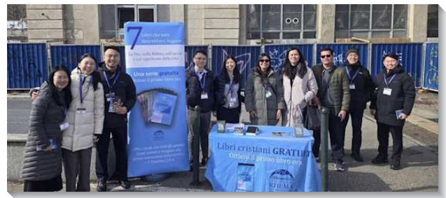
▲聖徒們到義大利配搭傳揚福音