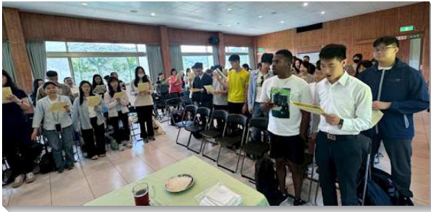
▲聖徒們喜樂相調聚集

目前會所主日基數是一〇五位，此次參加人數有一百三十九位，其中有兒童十九位、青少年十六位、大