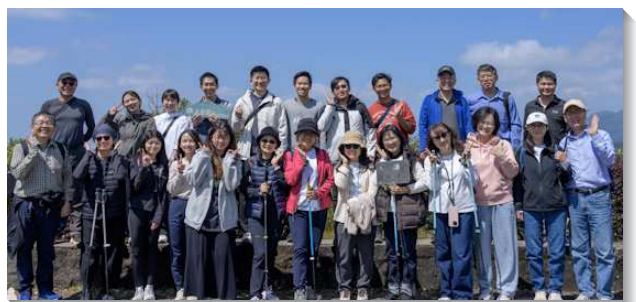
▲聖徒邀約福音朋友外出相調

在一次的相調行動中，一位姊妹邀請她的同事前來，另有一位平時忙碌、較少有機會接觸的福音朋友也答應參加，弟兄姊妹在行程中彼此自然關心，並分享自己得救及享受主的經歷，將生命的種子撒進他們的心裏，盼他們能得著救恩。願主加強我們，每次的相調行動都更經歷神的恩典與祝福。（江嘉尉）