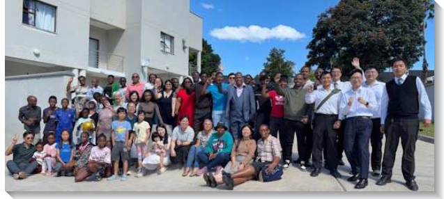
▲聖徒們配搭非洲史瓦帝尼福音開展

兩週開展期間，當地的聖徒也與學員們配搭出外傳福音訪人，陪家聚會，將人帶進召會生活。有位弟兄因至中國讀書接觸到主的恢復，回到史瓦帝尼後便帶母親來，而後他母親又邀她的朋友來。就這樣一個帶一個進入召會生活。我們看見這不是人的工作，實在是主的作為，我們只需要簡單的與祂配合。