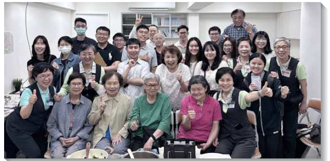
▲聖徒們與壯年班學員配搭傳福音帶人得救

開展當週，四十會所與八十四會所有集中禱告聚會，弟兄姊妹都被福音的火焚燒，感覺禱告摸著了