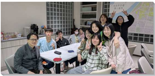
▲聖徒們配搭成全青少年

每週六早晨，青少年與服事者一同在早餐相調中享受主話、風雨無阻。也有好些青少年與屬靈同伴相約每天一同電話晨興，追求主話。彼此扶持，不僅建立了穩定的晨興生活，也養成早起親近主的好習慣，更