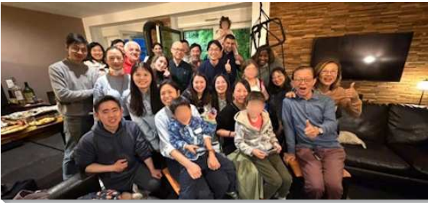
▲史特拉斯堡聖徒與學員們相調

史特拉斯堡Strasbourg位於法國東部，與德國接壤，二〇一八年恢復召會擘餅聚會，目前主日聚會人數約三十人，主要有華語和亞美尼亞移民的家，以及近年來不斷有新人看見聖徒們的彼此相愛、召會中有聖徒執行管家職分而受吸引。學員訪問了十個家，這些家彼此之間也能有更多的相調，願主繼續傾倒祂的祝福。