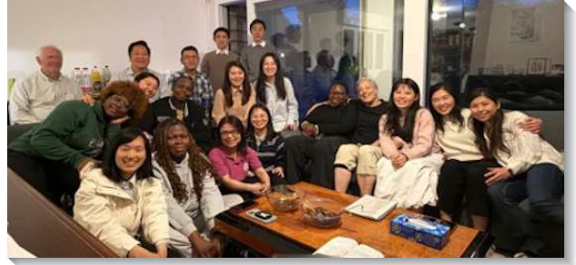
▲聖徒在魯昂排聚會與學員交通

迪耶普Dieppe為法國北方諾曼地地區的海港城市，距離魯昂約一小時車程。當地聖徒因讀到職事書報而於二〇〇五年開始與法語歐洲眾召會有交通，以Neuville-les-Dieppe召會的名義聚集。目前該地約十位聖徒，多為年長者。法國政府將在迪耶普附近擴建核電反應爐，預計提供兩千五百個工作機會，吸引大批青職、八千人移入迪耶普地區，因此很需要加強當地召會的見證。學員們於主日下午傳福音時，遇到一位在核電廠工作敞開的青年人。五月一至三日巴黎的聖徒們來訪相調加強，主日聚會便有住在附近的尋求者帶著孩子來聚會，看見自隱的神默默的在運行，看顧祂的選民。目前弟兄們正尋求整理土地及裝修會所，願主旨意成就。