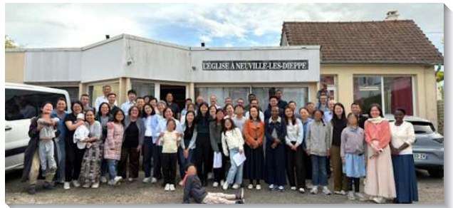
▲巴黎聖徒訪問迪耶普召會

一月最喜樂的莫過於里爾金燈臺的建立，二十四日週六在里爾有小型特會，二十五日則有召會第一次擘餅聚會。特會的總題是『新婦的豫備』，兩篇信息交通到我們必須獻上自己來愛主，並與眾聖徒建造在一起，成為一個團體的新婦。在主日聚會中，新人見證如何藉著聖經發送遇見聖徒們，移民到里爾的聖徒們見證牧養的喜樂，當地的聖徒見證自隱的神在背後的運行，法國的聖徒們見證為著里爾能興起召會，禱告