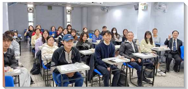
▲學生與聖徒們配搭銘傳大學福音

回顧主在銘傳大學的作為，感謝主一路的帶領與保守。求主繼續祝福此校園的開展，能結出更多常存的果子，使學生們在生命裏長大，在配搭中被建造，為主在銘傳大學的校園工作剛強開拓。（陳恩湛）