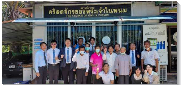
▲學員們與聖徒在泰國傳揚福音

在非洲基督教背景濃厚的辛巴威，多數人都讀過聖經。學員們在辛巴威大學向學生講說神的經綸，並與人家聚會。當學員們向人開啓真理時，學生們不僅渴慕更多認識主話，甚至有學生在學員離開前，拿著恢復本聖經一同向人傳講。願主藉著這分職事的開啓，得著更多青年人成為主在當地的見證。