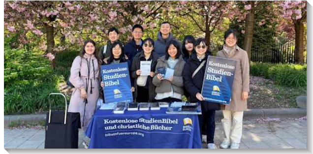
▲學員們與聖徒至德國福音開展

因國際局勢與戰爭影響，歐洲與非洲開展隊的航班頻繁變動。然而學員們不喪膽，反而更迫切的為主在全地的需要禱告，學習順服主的帶領，竭力將職事的豐富帶給各地的尋求者。在德國，當地聖徒為著開展期間的聖經講座禱告了許久，盼望主將敞開的人帶進聚集中。會後，一位學生分享，他至今才明白『靈與魂』的分別。這讓學員們深感，對我們而言習以為常的真理，對當地人卻是如此新鮮寶貴。眾人深受激勵，不再受限於語言