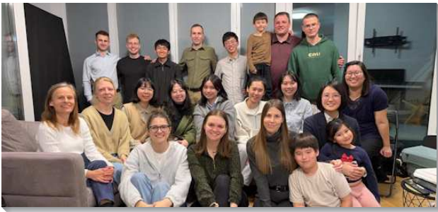
▲學員們與聖徒在波蘭傳福音

在亞洲各國，學員們雖面對文化、語言和國籍的限制，仍竭力將人遷到基督裏。在泰國的開展中，學員們用華語講說真理，聖徒即時翻譯成泰語並見證自身經歷。藉著同心合意的配搭，帶來真實的衝擊力。短短五週內，共有一百〇六位新人得救，願主親自記念他們，在生命裏長大，盡功用並建造基督的身體！