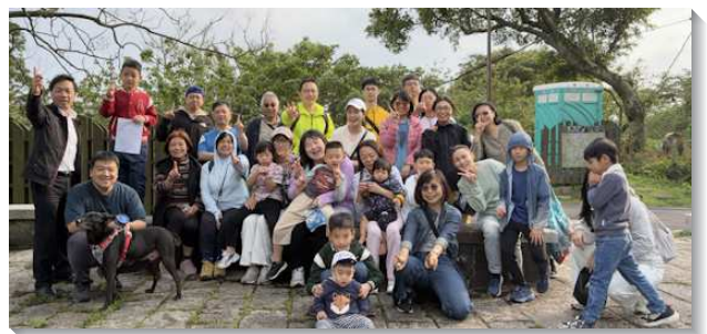
▲聖徒們邀約親子參加兒童排相調

兒童工作其實是『得家長』的工作，也是『得一個家』的工作。不僅孩子們彼此作屬靈同伴，父母也逐漸被帶進甜美的召會生活中。盼望未來能持續藉這樣的實行，使兒童排不只是人數穩定，更能帶進繁增，使召會年輕化，並把更多家帶進神的家。（楊鎮丞）