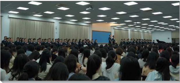
▲全時間訓練秋季班呼召聚會在三會所舉行

本次呼召聚會的主題為『得勝者的勝利』，以但以理書為背景，描繪在神子民被擄，神的見證遭破壞的黑暗時代，仍有一班青年人，就是但以理和他的同伴們，願意立定心意，為神的權益站住。他們是得勝者，絕對與神是一，勝過撒但一切的詭計與欺騙；他們勝過屬鬼的飲食，拒絕善惡知識樹所代表獨立於神的生活，反而揀選生命樹所表徵的神自己作生命和供應，使他們在生命裏與神聯結並成爲一。他們也勝過