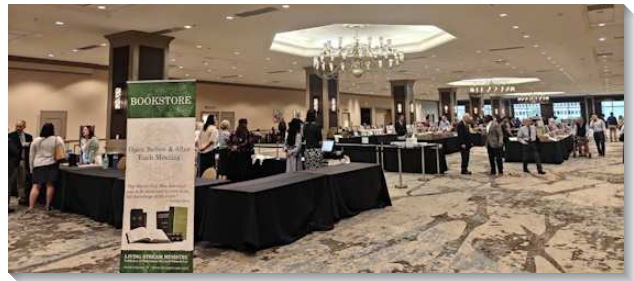
▲聖徒們參加美國的國殤節特會

第五、六篇則說到『按著神牧養』。牧養，原是復活、升天的基督作牧者（詩二三），在祂的死與復活