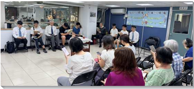
▲聖徒們與建中學生參加主日聚會

學生弟兄們作主福音的管道，每週邀請同學朋友來到校園小排中，藉著詩歌與信息撒播福音的種子。學員與服事者於每天放學後在校園周邊接觸人，尋找願