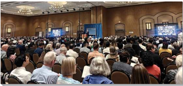
▲國殤節相調特會在美國德州達拉斯舉行

這次特會的總題是『極其需要新的復興』。是在主僕人離世後，自一九九九年國殤節特會『新的復興』、二〇一五年國殤節特會『需要新的復興』，第三次交通到『新的復興』這個主題。從總題的進展可以知道，今日對於豫備主回來之『新的復興』的需要，是越過越迫切。盼望藏在主心頭的渴望，也能成為我們的渴望，並成為今日召會生活『極其需要』的恢復和實行。