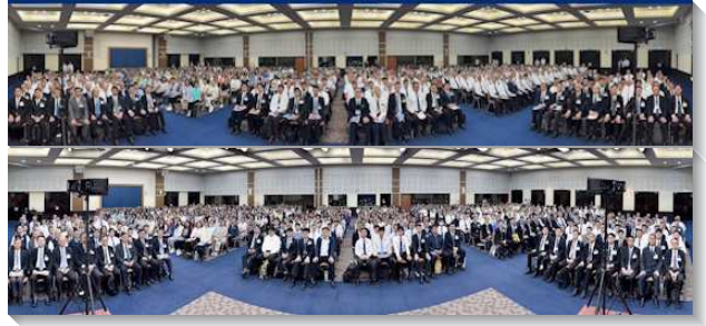
▲聖徒們分兩梯次參加在台灣的國殤節特會

第二篇說到新的復興的第一方面—『達到神聖啓示的最高峰』。這裏的『達到』，說出這是一個過程。真理的啓示，一路自倪柝聲弟兄對神的救恩、召會、基督作生命、基督的身體這些真理主要項目的看見有進展；且經過李常受弟兄看見基督與召會、神的分賜、神的經綸，直到『神成為人，人成為神』而達到最高峰。今天在我們裏面，也該在對真理的啓示與構成上達到最高峰。『神成為人，為要使人在生命和性情上，但不在神格上，成為神』乃是聖經這『盒子』裏的『鑽石』，我